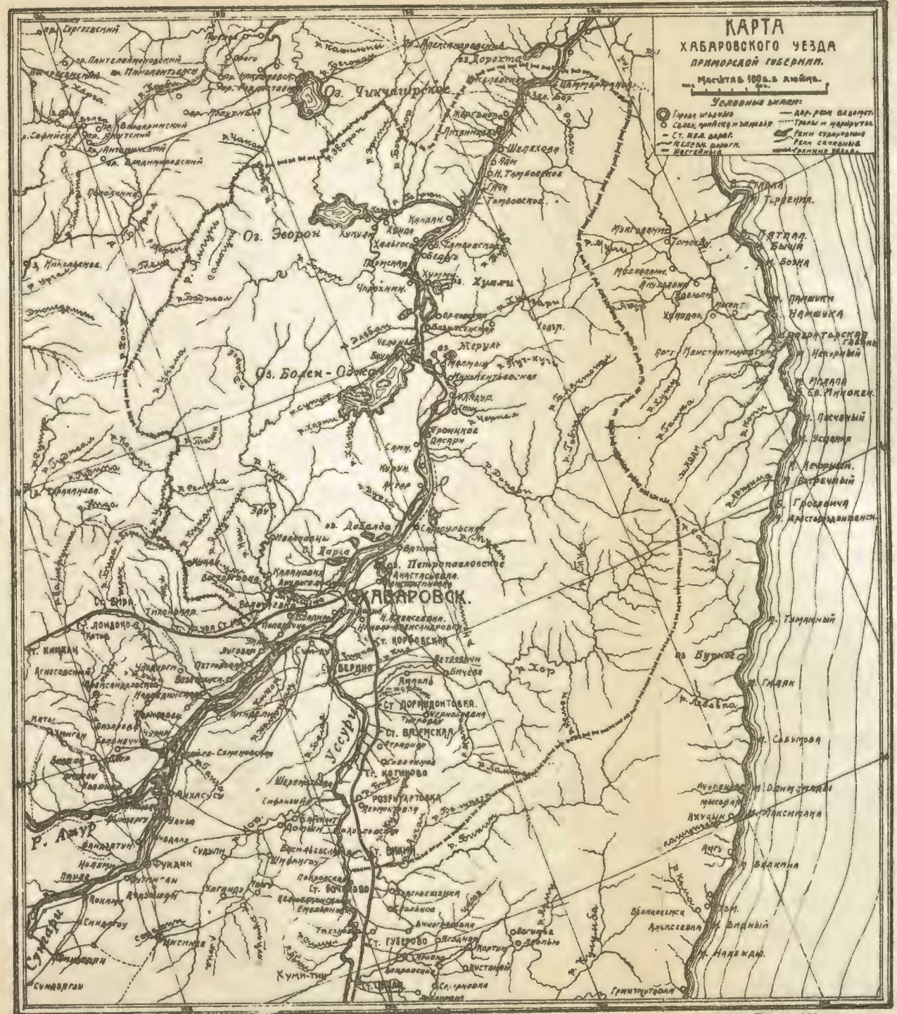
Г. Хабаровск, Тиво-лит. Упр. Усе. ж. д.