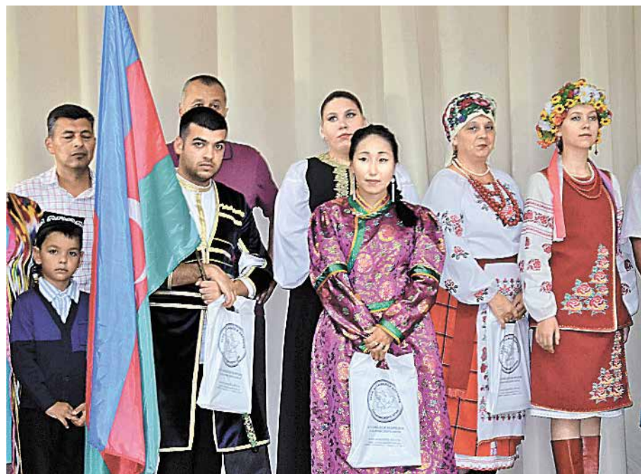
Традиционные черты дальневосточного социума — многонациональность и веротерпимость. Большая часть нынешних приамурцев — потомки «пришлых» людей. Это уравнивает всех. А сложные условия жизни и вовсе располагают к сотрудничеству, а не к соперничеству

Эти тенденции в дальнейшем, с установлением советской власти, только усилились, поскольку «миграционные» волны по Дальнему Востоку стали ходить туда-сюда совершенно непредсказуемо, и несколько десятилетий почти никто не мог с уверенностью сказать, что он коренной житель Хабаровского края всерьез и надолго. И, напротив, в других регионах страны никто не мог быть уверен, что завтра не станет хабаровчанином. Так, например, перепись 1939 года зафиксировала в Хабаровском крае почти полное отсутствие корейцев — всего 200 человек. Поскольку двумя годами раньше их почти всех (75 294 че-