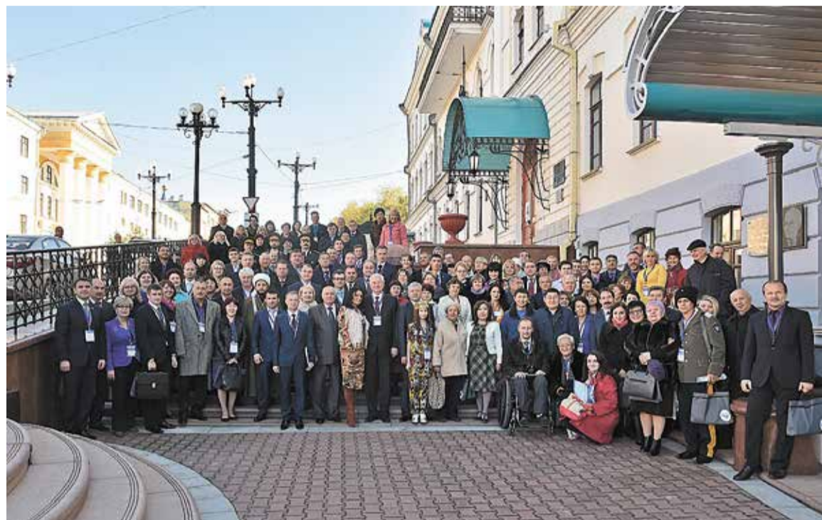
ВЗАИМОПОНИМАНИЕ И КУЛЬТУРА ВЗАИМОДЕЙСТВИЯ НАЦИОНАЛЬНЫХ ОБЩЕСТВЕННЫХ ОБЪЕДИНЕНИЙ СО СМИ СТАЛИ ВЕДУЩЕЙ ТЕМОЙ РЕЗОЛЮЦИИ. ОЦЕНКУ ПОЛУЧИЛА И ПРОБЛЕМА КОРРЕКТНОГО ОСВЕЩЕНИЯ СОБЫТИЙ В СФЕРЕ МЕЖЭТНИЧЕСКИХ ОТНОШЕНИЙ

Официально утверждена итоговая резолюция Дальневосточного гражданского форума, который прошел в Хабаровске в октябре 2015 года. Напомним, что целью этого значимого для региона мероприятия стало обсуждение проблем развития гражданского общества и выстраивание открытого диалога, консолидация совместных усилий представителей общественных организаций и объединений, бизнес-сообщества, органов исполнительной и законодательной власти, органов местного самоуправления, средств массовой информации для формирования современного гражданского общества, развития гражданской инициативы и роста гражданского самосознания населения, повышения качества жизни дальневосточников.