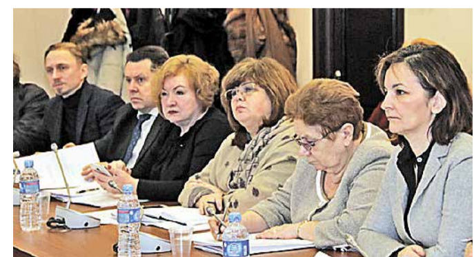
Участники заседания обсудили основные цели, задачи и подходы к формированию Государственной программы, а также рассмотрели перечень подпрограмм и основных мероприятий документа

Государственная программа должна быть направлена на решение задач по укреплению единства российской нации, обеспечению межнационального мира и согласия, этнокультурное развитие народов Российской Федерации, сохранение и развитие языков народов России, развитие системы гражданско-патриотического воспитания, создание условий для социальной и культурной адаптации мигрантов, профилактику экстремизма, развитие государственной политики в отношении российского казачества.