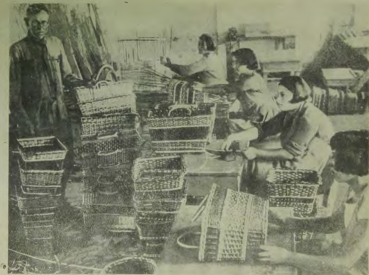
Еврейская автономная область. На сн.: артель лозоплетения в „Икоре“, Смидовичского района

Шлойме — жизнерадостный человек, он никогда не унывает, а если взгрустнется — затянет песню, старую, родную. Фейге под бодрящие звуки песни кажется, что в этом общежитии не так уж плохо, не так уж тесно. С Шлойме не пропадешь!