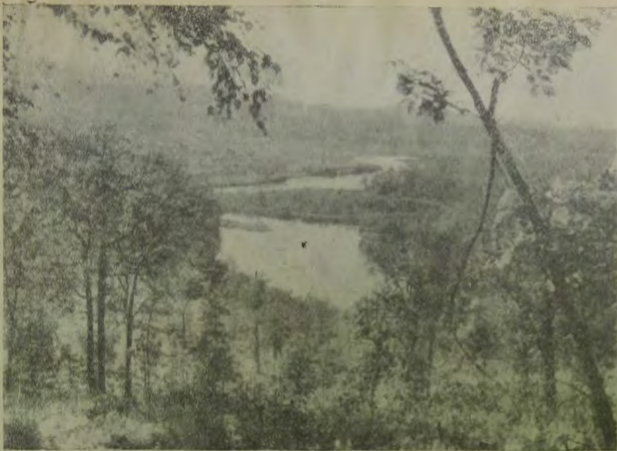
Еврейская автономная область. Вид на реку Бира и таигу