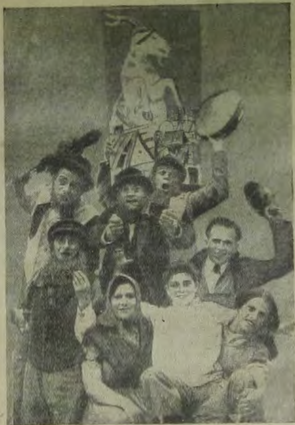
Крымский еврейский колхозный театр. На сн.: сцена из пьесы „Уфганг“ („Восход“) по рассказу „Сорняки“ Э. Гордона

Развернутая театром массовая работа в свойственных ему формах оказывает большую помощь местным организациям в их политико-воспитательной работе. К числу удачных видов массовой работы театрального коллектива нужно отнести выступления артистов на квар-