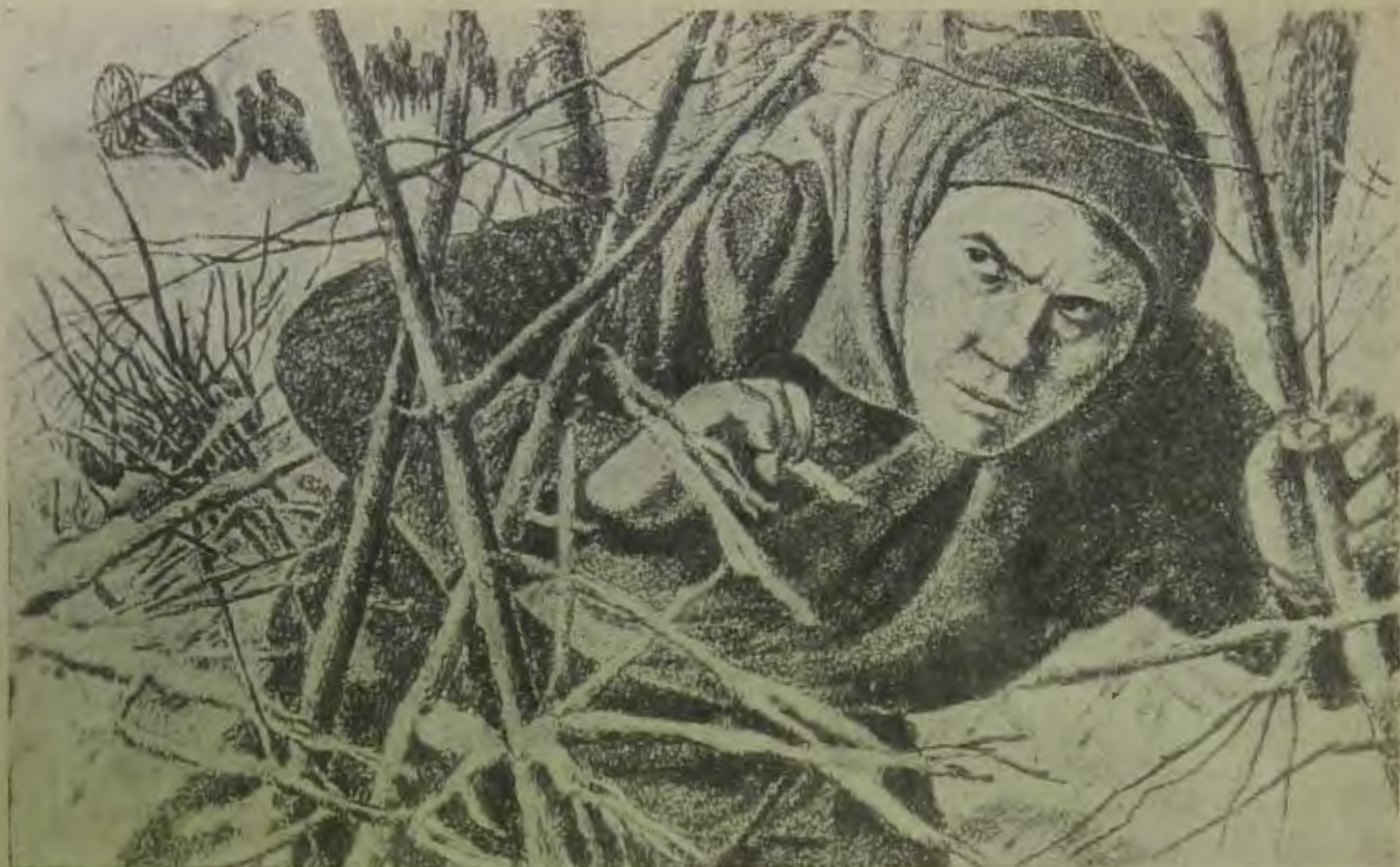
«Женщины были лучшими нашими разведчиками» (Перепечатано из книги «Таежные походы» из-во «История гражданской войны», 1935 г.)

чении количества платных работников, в связи с разукрупнением районов.