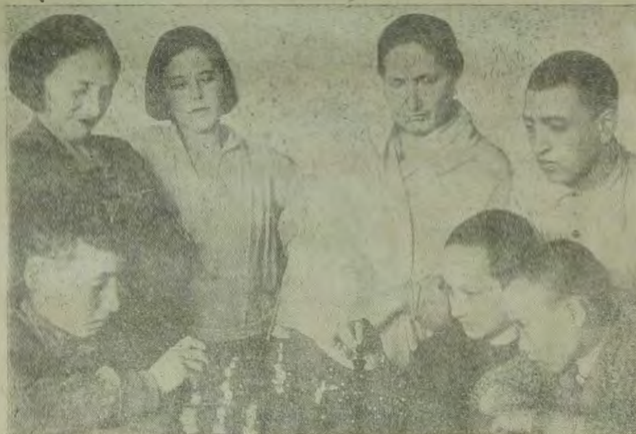
В Еврейскую автономную область — на постоянное жительство. На сн.: семьи окончивших курсы платников в Москве

Бобруйский райозет провел значительную работу при отправке в область транспортников. Но на этом он успокоился. За 1935 год в Бобруйске сменилось 5 секретарей райозета. Учет членов здесь не ведется.