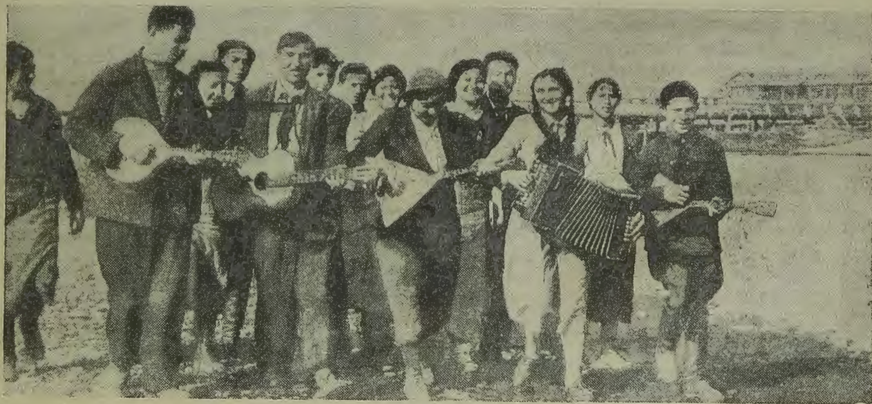
ЕВАО. гор. Биробиджан. Студенты педтехникума на прогулке