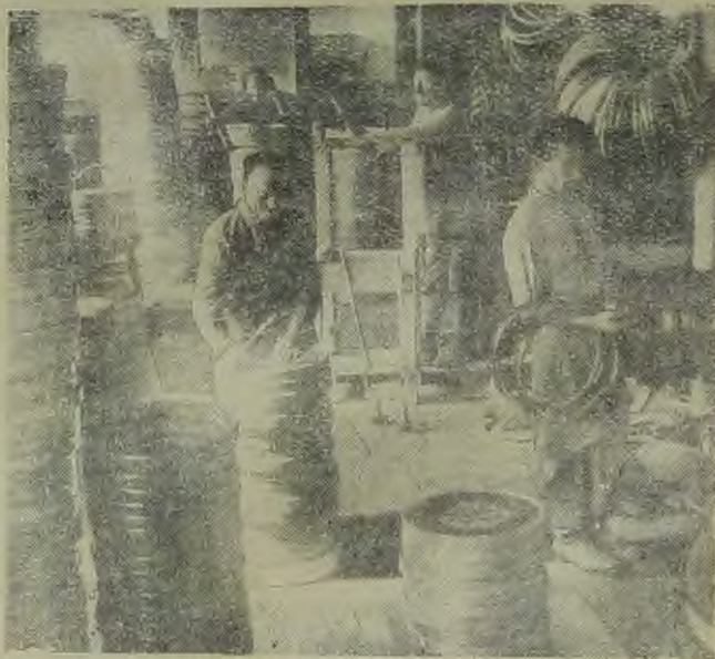
ЕВАО. Мебельные ф-ки ЕВАО снабжают своей продукцией—ДВН На снимке: цех производства стульев мебельн. ф-ки им. Димитрова в г. Биробиджане