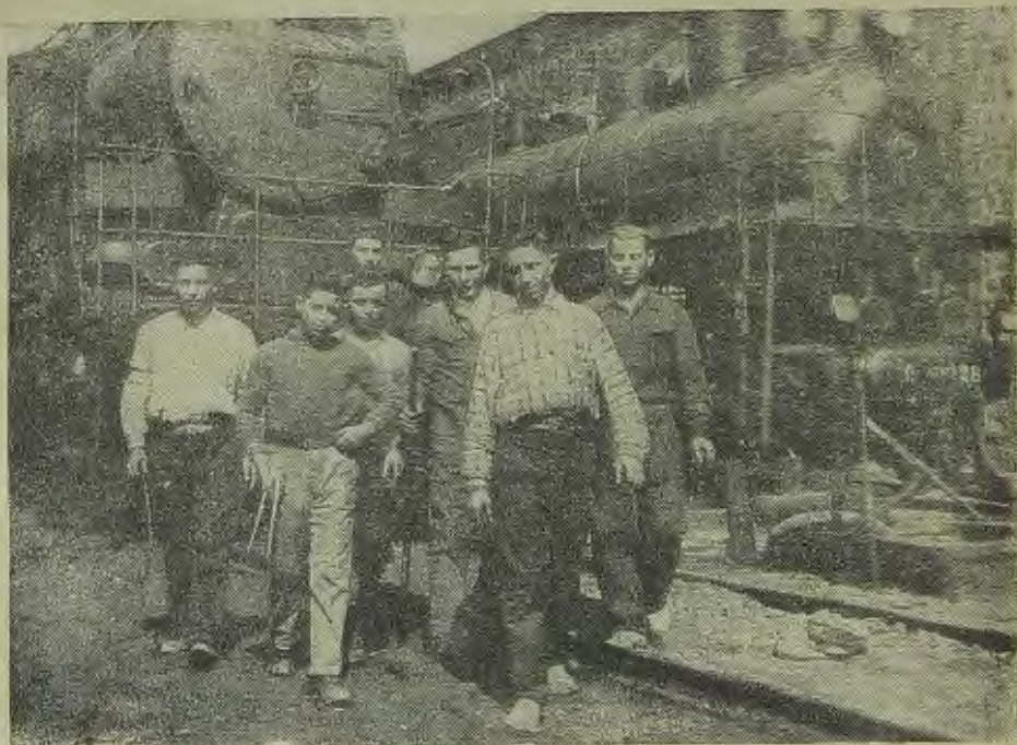
ЕвАО. Еврейская молодежь на транспорте

2) Наркомзем. Размер капитальных затрат на развитие с.-х. и на сельскохозяйственное переселение определяется в 8,2 млн. руб. безвозвратных капитальных и 9,6 млн. руб. долгосрочного кредитования, а всего 17,8 млн. руб. против 7,5 млн. руб. в 1935 году — увеличение на 237 проц. Наркомзем должен в 1936 году построить 3 новых машино-тракторных станций и одну машино-тракторную мастерскую с необходимым для этих предприятий производственным и жилищным строительством; произвести мелиоративные работы на 8300 гектар; подготовить проект по осушке в 1937 году 20 тыс. гектар; завезти в Еврейскую автономную область в 1936 году 90 новых тракторов, 40 комбайнов и 45 автомашин, 1700 коров, 285 лошадей; довести в 1936 году посевную площадь по колхозному сектору области до 27 тыс. гектар, а с учетом посевплощадей совхозов, орсов до 43 тыс. гектар; поднять 10.000 гектар целины; построить 600 домов с усадебными постройками, из которых 300 домов для переселенцев 1937 года. Всего Наркомзем должен переселить в 1936 году 300 семей в колхозы и 400 строительных рабочих, а всего 1725 человек, из них 1200 чело-