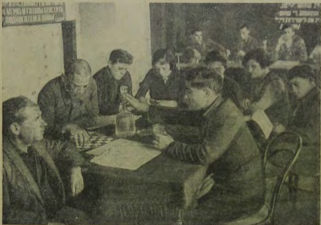
ЕвАО. Новые переселенцы в красном уголке Дома переселенца в гор. Биробиджане