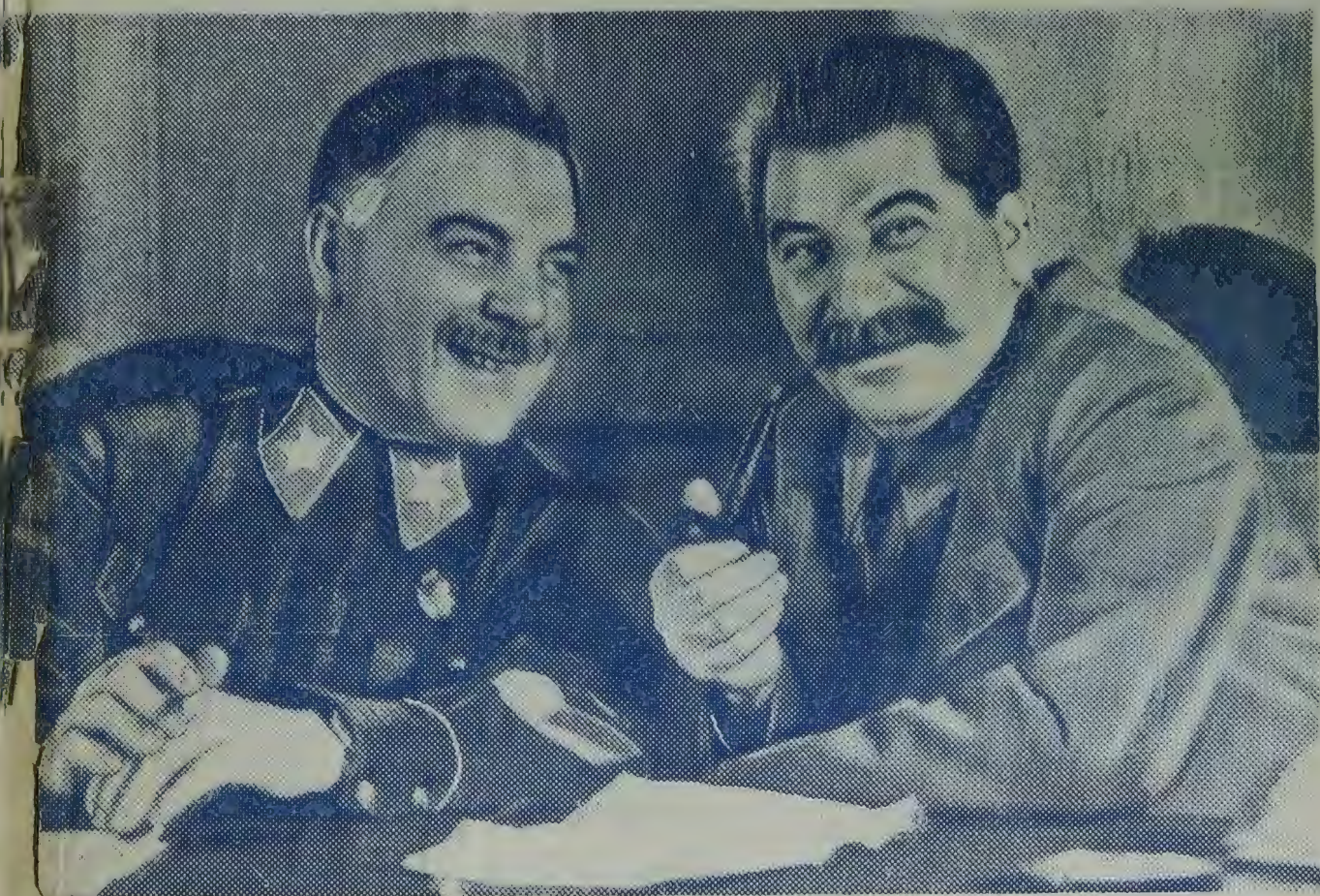
Варищи Сталин и Ворошилов на приеме делегатов трудящихся Бурят- ингольской АССР руководителями партии и правительства в Кремле