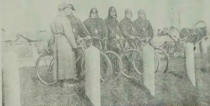
Участники велопробега Одесса—Владивосток в гор. Биробиджане.