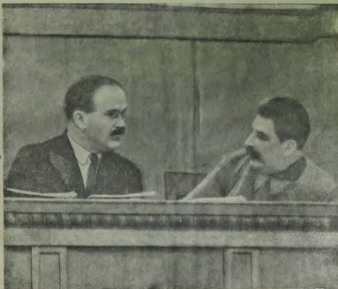
Товарищи Сталин и Молотов в президиуме 2 сессии ЦИК Союза ССР VII созыва