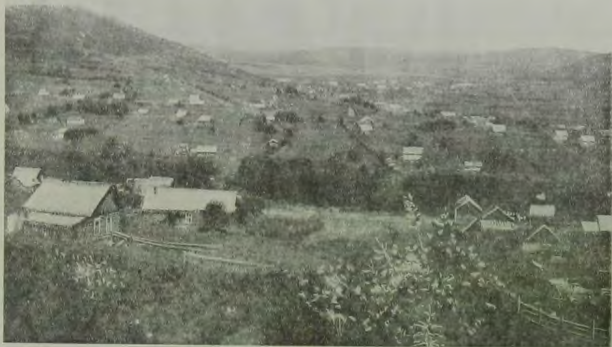
ЕвАО. Общий вид поселка Биракан