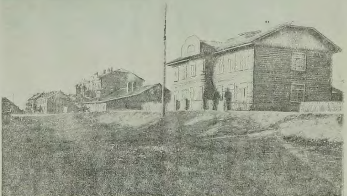
ЕваО. Недавно расширенная улица—Партизанская—в Биробиджане

Промартель «Колесо Революции» к 23 декабря выполнила свой годовой план на 103%.