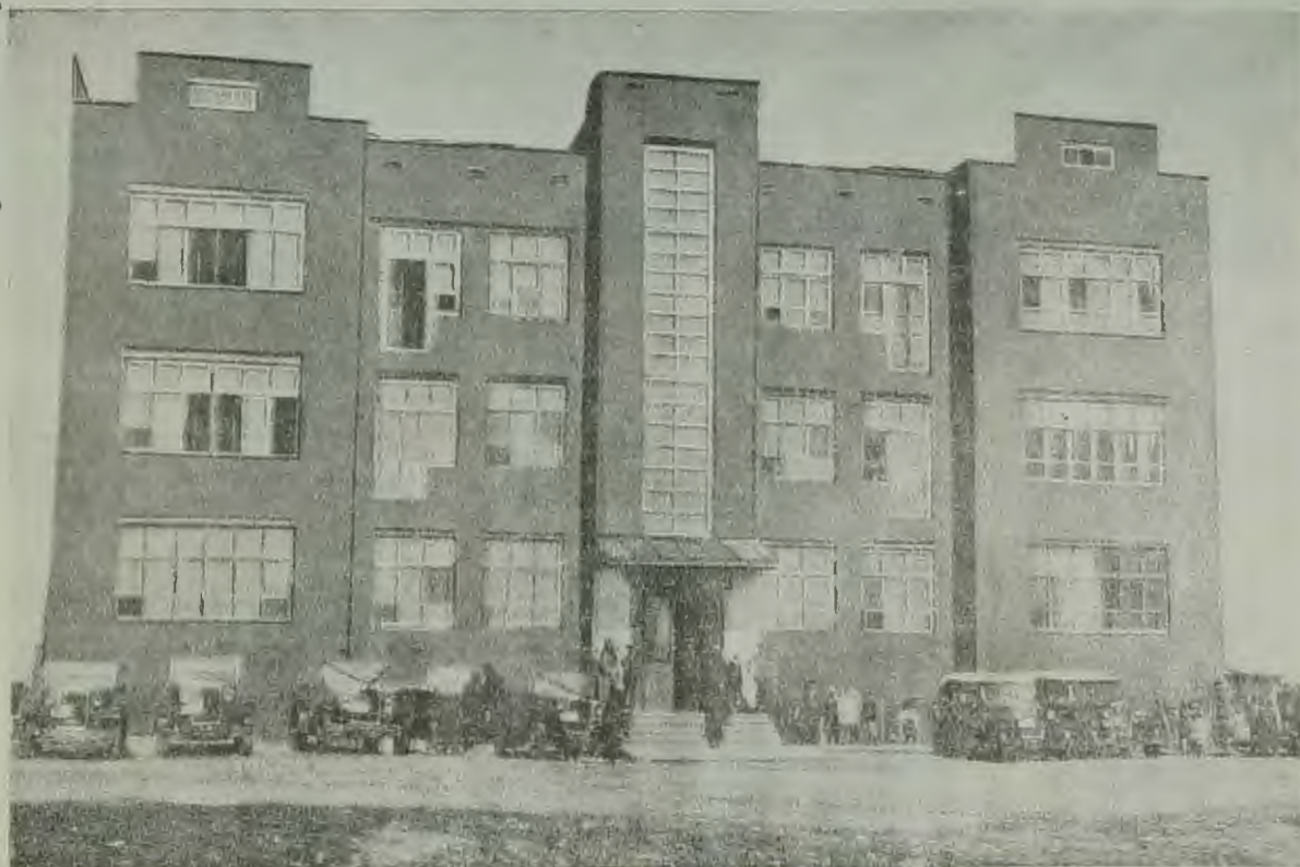
ЕВАО. Новое трехэтажное здание дома советов в Биробиджане