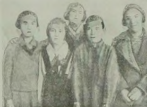
Лучшая группа активистов ЮДО 23-й школы 10 летки в Днепропетровске