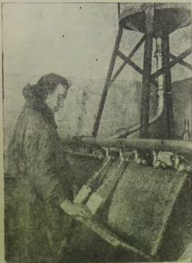
Украина. молочно-городная коммуна „Червона Зоря“. Разлив кефира.

социалистического сельскохозяйственного сектора в других районах.