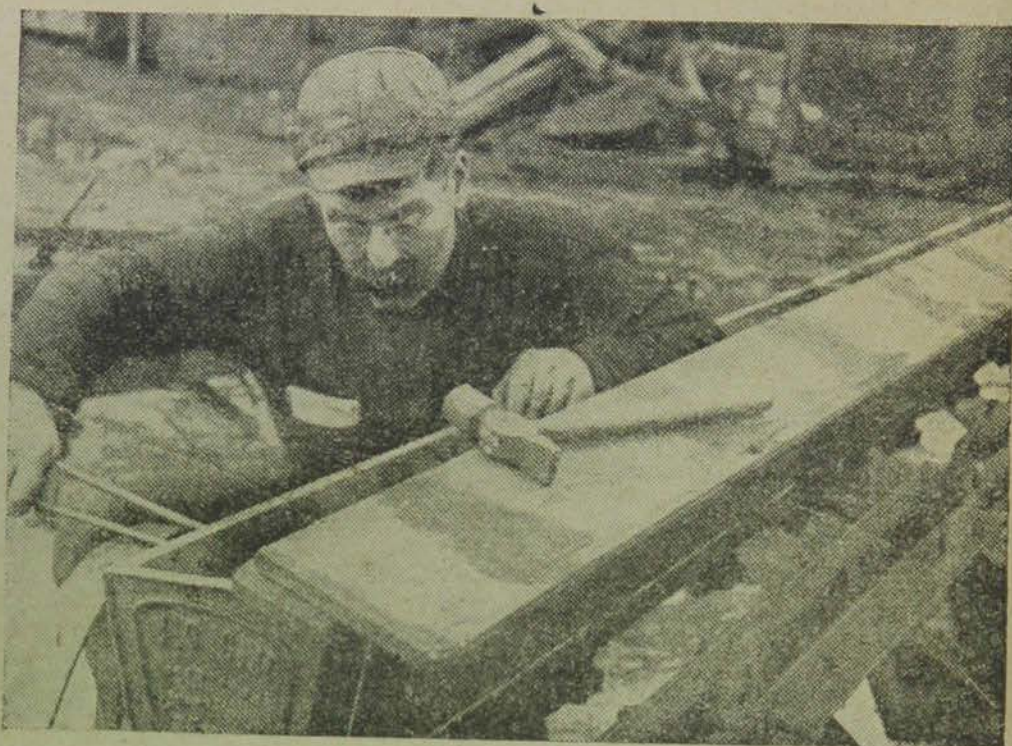
Крым. Готовятся к весеннему сезону.