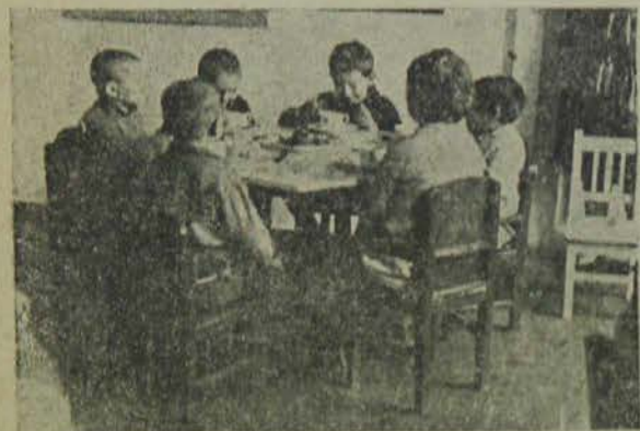
Украина. Еврейский детский сад. Дети за завтраком.

1) Максимально облегчить прием переселенцев путем оборудования и расширения прием-