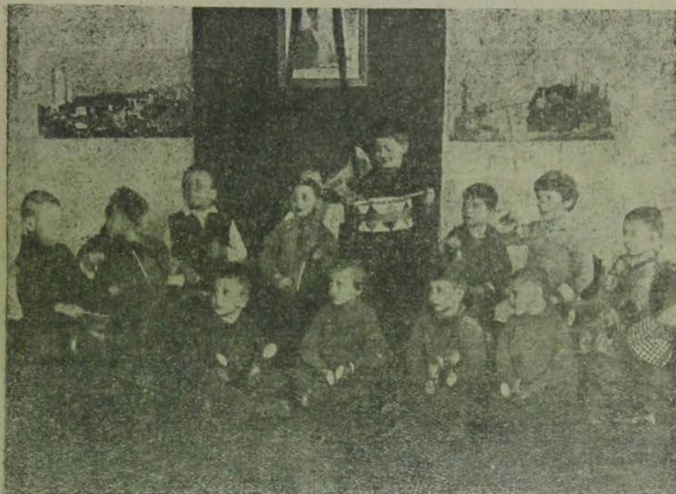
Украина. Ев. детский сад. Дети организовали шумовой оркестр.

Характер шефской работы Мосозета за последний год также изменился. От системы отпусков ассигнований он перешел к системе до-