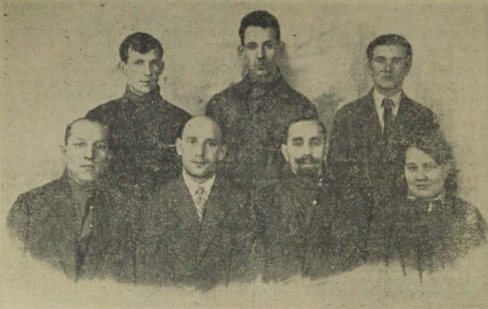
Бригада Ленозета в Биробиджан.

15 декабря ленинградская организация, в лице общегородского актива, совместно с