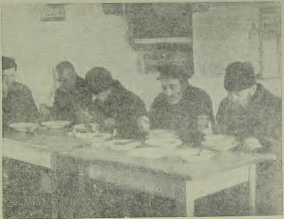
Упр. фонды. Общественная колхозная столовая.

Выполнение плана хлебозаготовок мы приурочили к октябрьским торжествам, ссыпали в элеваторы 780 тыс. пудов хлеба, выдвинули