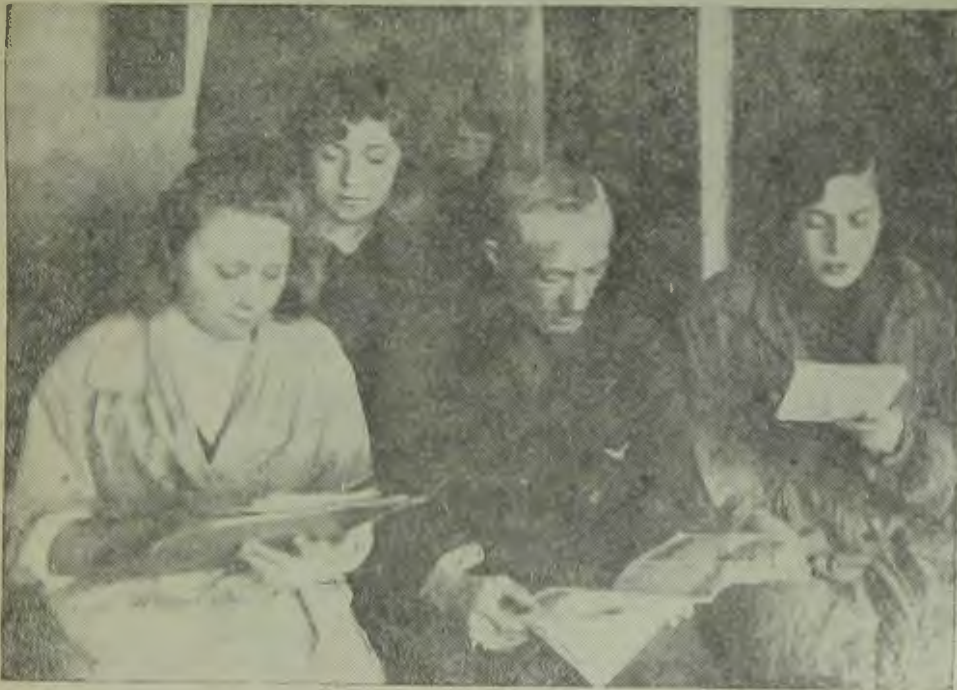
Харьковские пролетарии читают в обеденный перерыв «Трибуну»