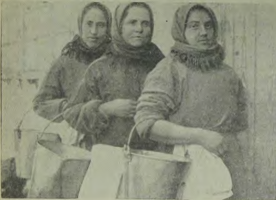
Ударная группа доярков-переселенков