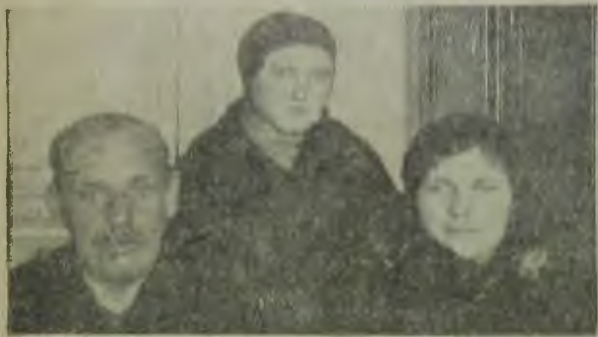
Хозрасчетная бригада им. ОЗЕТ на Гознаке

Бригада обязалась стать образцовой по всем показателям — повысить качество выпу-