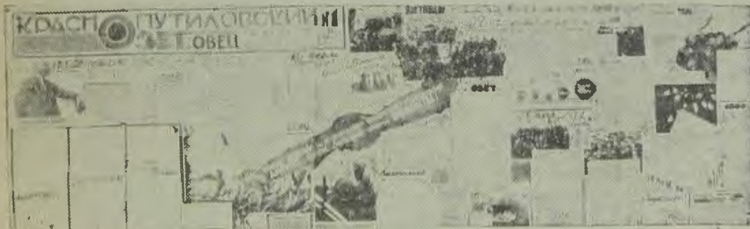
Краснопутиловцы рапортуют 2 пленуму ЦСО