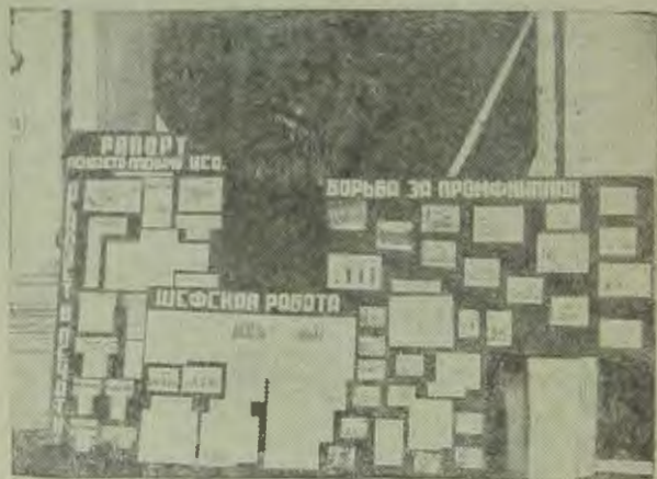
Рапорт ЛЕНОЗЕТА 2 пленуму ЦСО

Лучшие показатели по проведению кампании 8 марта дали Нарвское, Выборгское и Петроградское райотделения, а из ячеек — з-да «Красный Путиловец», ф-ки «Скороход» и з-да им. Кулакова.