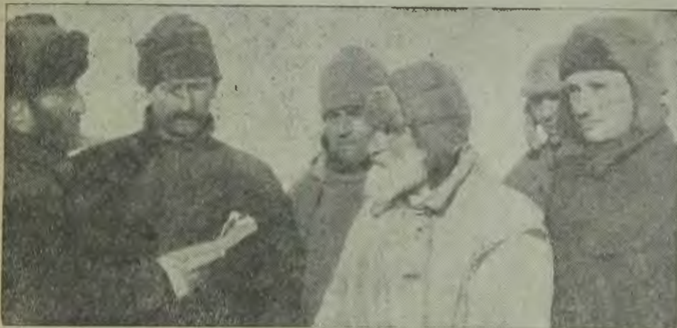
УКРАИНА. Колхоз „Путь и социализму“.

Ударная бригада колхоз- ников получает задание по посевкампании.