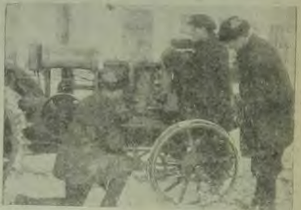
Калининдорф. Проверка отремонтированного трактора.