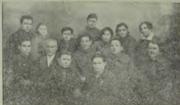
МОСКВА. Актив ОЗЕТА Бумагоотделочного объединения