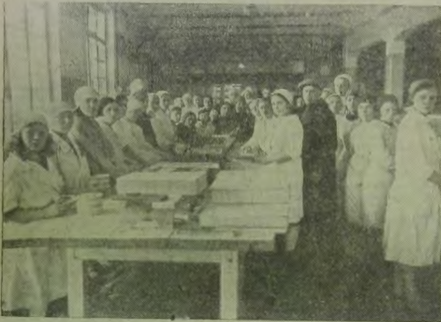
МОСКВА. ф-на „Ударница“ Мармеладный цех 4-я бригада им. ОЗЕТ

Оказывать решительное противодействие всем пройскам классового врага, пытающего-