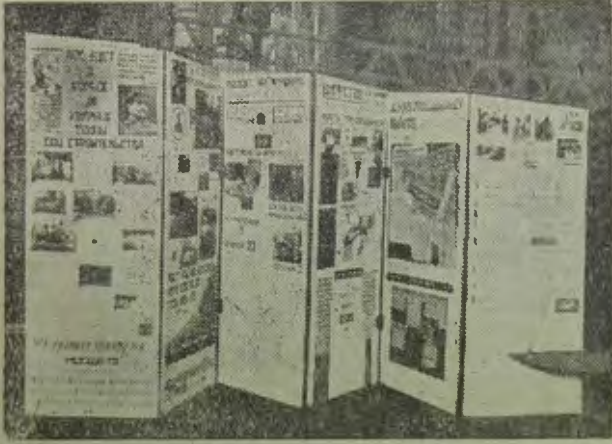
Репорт МОСОЗЕТА в цифрах и диаграммах 2 пленуму ЦСО.

Центральными задачами, стоящими перед Озетом на данном этапе, являются: решительное укрепление, на основе шести условий