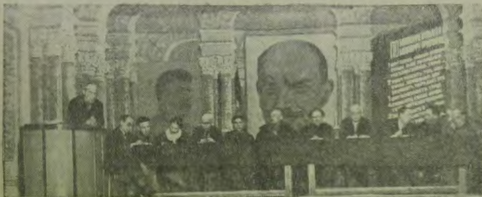
Президиум 2 пленума ЦСО

Для укрепления районов массового вселения нужно, чтобы не только в Биробиджане,