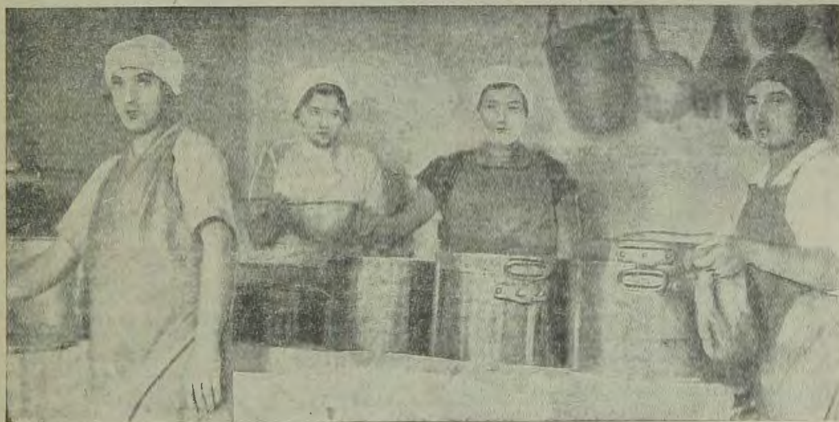
Войо-Ново. Приготовление пищи на кухне общественного питания

Мы уверены, что при разрешении вопроса о деятельности «Допомоги» в местечках будут взвешены также и все доводы тов. Донского, несмотря на то, что мы в них все же не находим достаточно веских мотивов против выводов, сделанных тов. Эйдельманом.