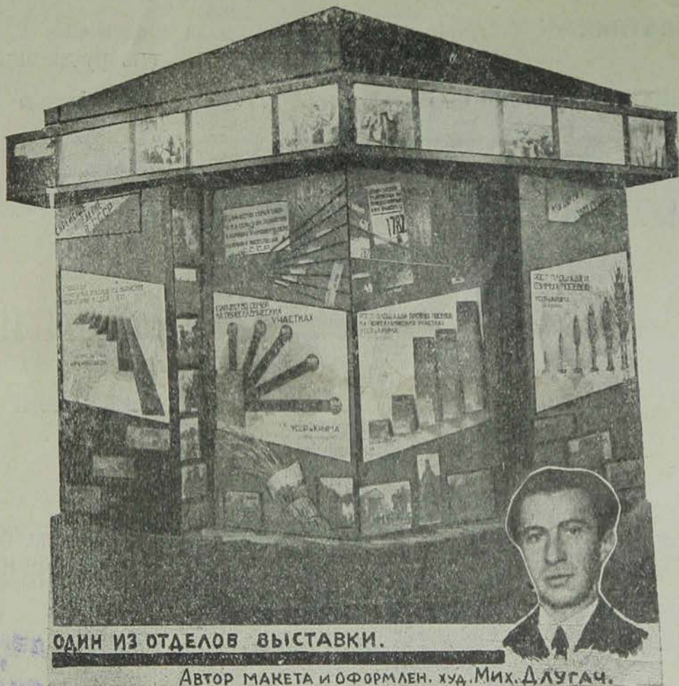
ОДИН ИЗ ОТДЕЛОВ ВЫСТАВКИ.