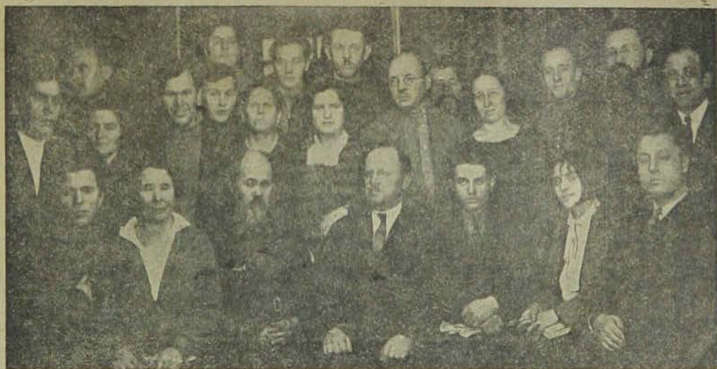
Московская делегация на 2 Всесоюзном с'езде ОЗЕТа