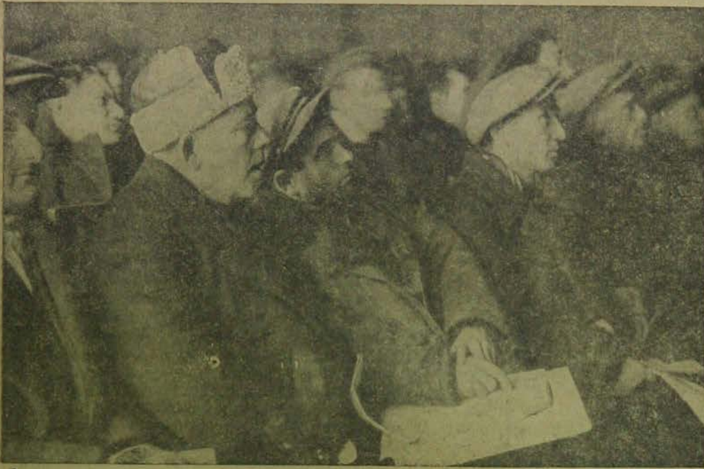
Делегаты III Всеукраинского с'езда ОЗЕТ состо- явшегося в Киеве 5—8 декабря