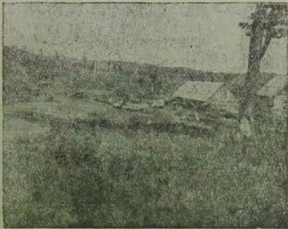
Биробиджан, поселок на 22-ой версте

трестов (Зернотреста, Колхозцентра, Скотовода, Рисотреста, и пр.), с соответствующими коррективами для специфических условий Биробиджана. У означенных организаций накопилось уже достаточно материалов, которые