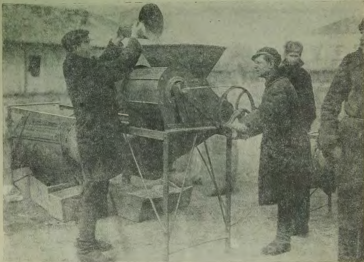
Сортировка семян триером