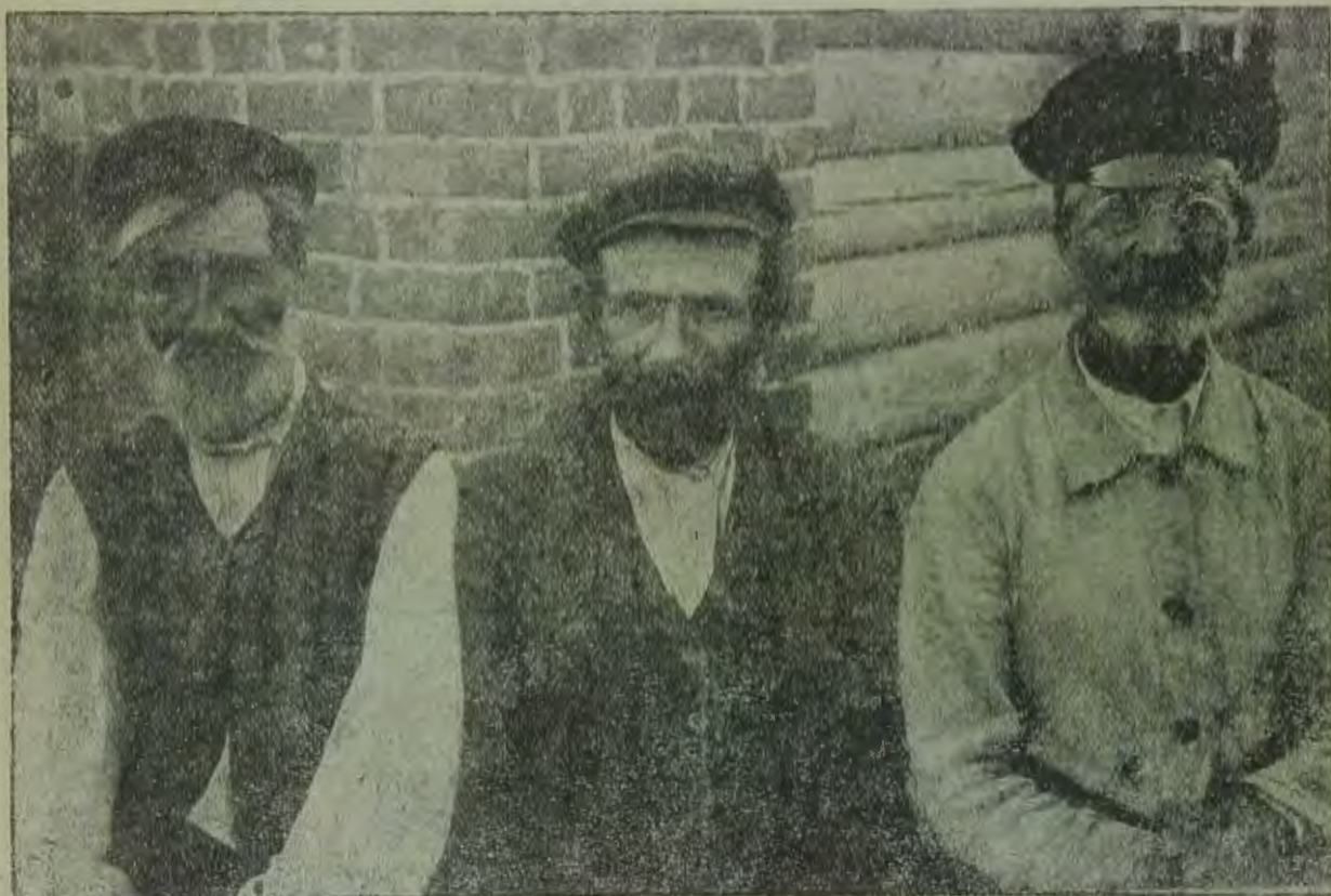
Белорусс, еврей и поляк из интернационального колхоза „Новый свет“ Гомельский окр.