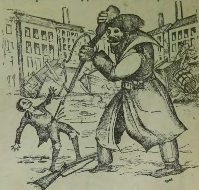
„и прободал штыком живот“.

И тогда маленький Сендерл появился на вершине баррикады. Он сорвал с