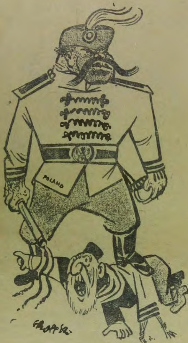
„Караул! Советы уничтожают еврейский народ...“

именно религия явилась наиболее крепким и гибким звеном.