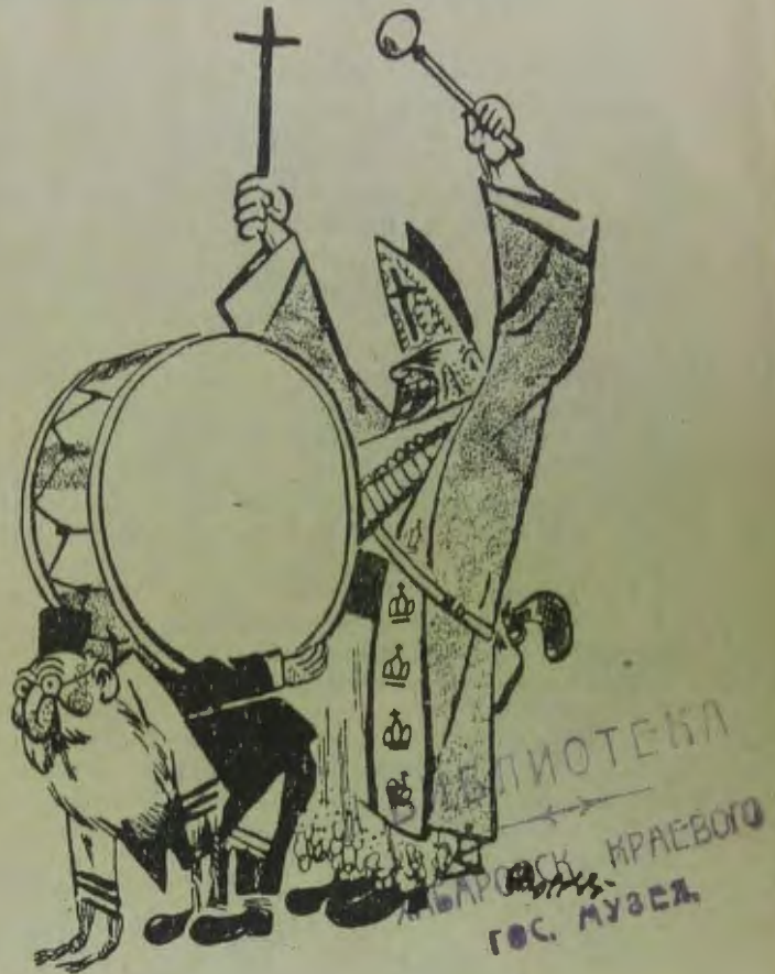
Поход святых синоморохов.

Этот «крестовый поход» не случайно совпал с движением в сторону сплошной коллективизации целых районов и областей. Сплошная коллективизация на Украине и в Белоруссии захватила также и десятки еврейских местечек, раскрыв перед их нищим населением совершенно новые, небывалые экономические перспективы.