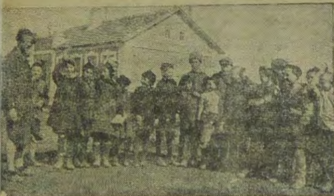
Сталиндорф, евпат. района. Шнольники-пионеры с учительницей перед зданием школы.

1) Всемерно содействовать развитию кустарно-промысловой кооперации и в первую очередь тех ее отраслей, которые не работают на дефицитном сырье и в которых значительное место занимает женский труд.