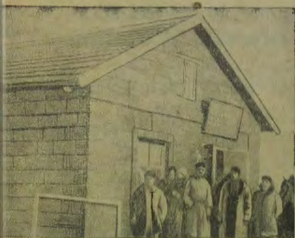
Кооперативная лавка в еврейском поселке в Крыму