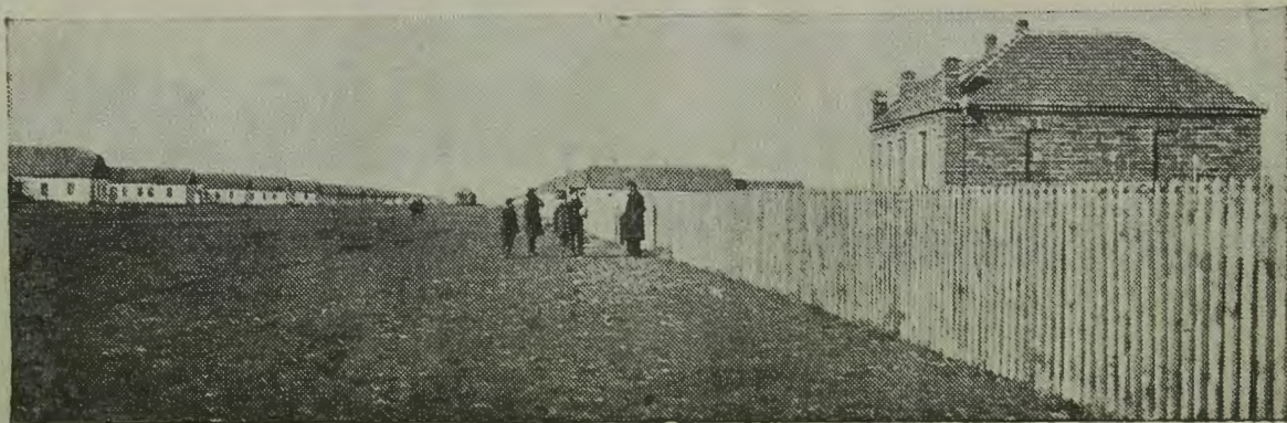
Поселок Икор в евпаторийск. районе; справа — школа.