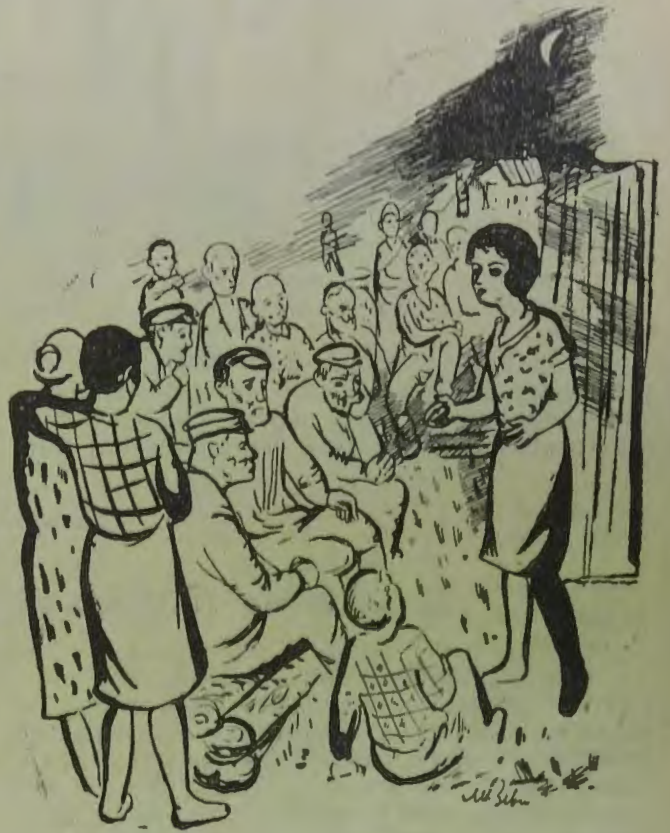
„Любу окружила группа коммунаров.“

А почему, например, до сих пор ей не сообщили, даст агроном сноповязалку или не