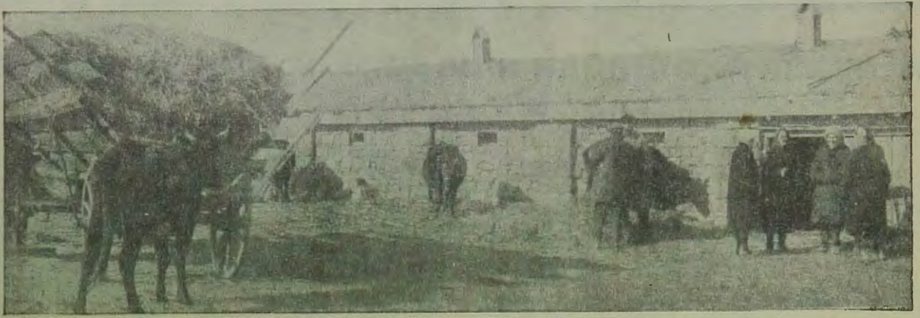
Обобществленный сютный двор на 74 уч. евпаторийского района.