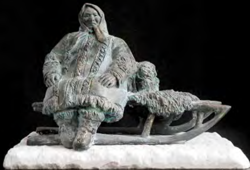
Из серии «Народы Дальнего Востока: бытовые сценки», скульптурная композиция Автор – Наталья Волченкова, г. Домодедово

дыры, тропинка вскоре вывела на равнину, и стало светло. Болчан увидел юрты, оленей и людей. Люди узнали Болчана и обрадовались, но из толпы вылез толстенький Бун'нюли и закричал: