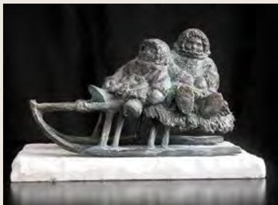
Из серии «Народы Дальнего Востока: бытовые сценки», скульптурная композиция Автор – Наталья Волченкова, г. Домодедово

сестер. После еды и чая он нарубил дрова и принес из речки воды. Утром женщина предупредила Болчана, что в конце пути станет темно-темно, но вскоре появится огромная дыра, станет светлее, и постепенно он выйдет наружу к людям из его стойбища. Затем она потеряла мягкой шкуркой посох: «Посох не простой, не забывай о нем, он всегда поможет тебе».