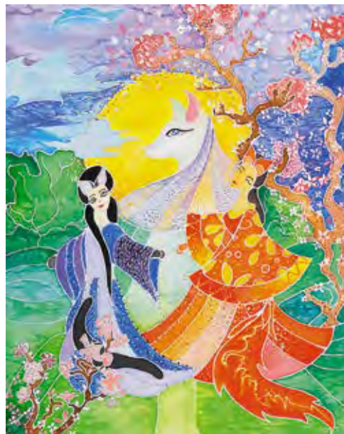
«Белая красавица, Огненная красавица да Кошка-царевна», батик Автор – Виолетта Литвинова, г. Свободный