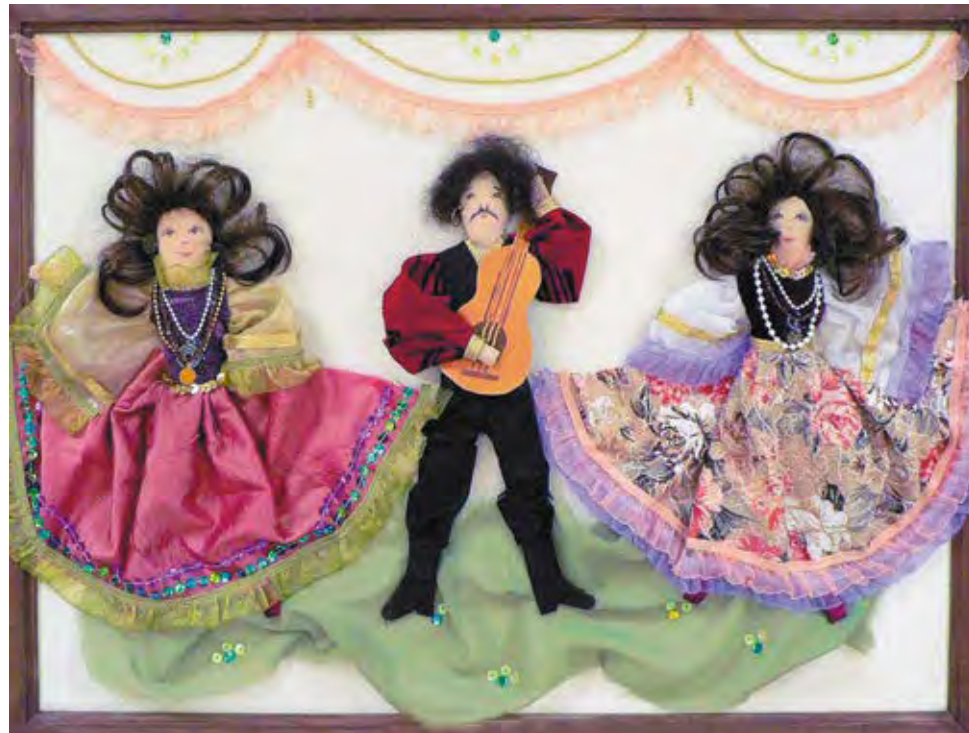
«Цыганский танец», коллаж Автор – Дарья Храмцова, г. Сальск