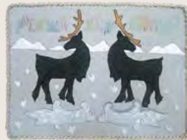
«Страна оленей», текстильная аппликация Автор – Ангелина Тарасюк, г. Билибино