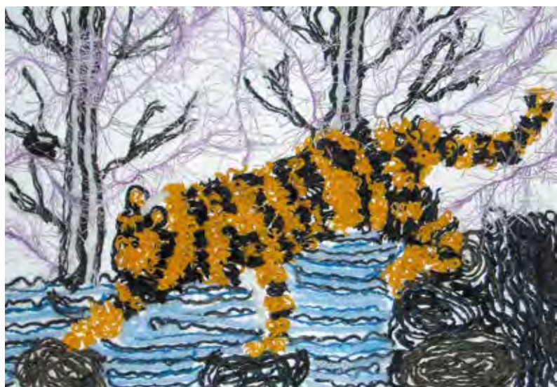
«Дальневосточный край», панно Автор – Ксения Девяткина, г. Улан-Удэ