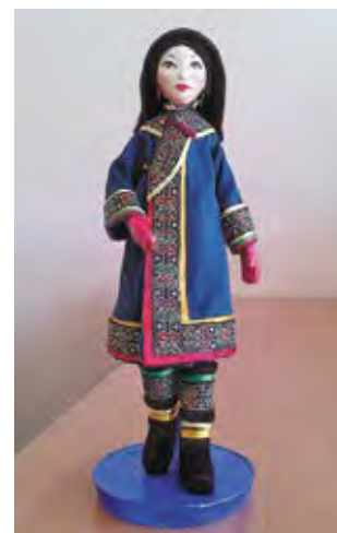
«Девушка Приамурья», скульптура