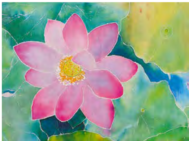
«Лотос – солнечный цветок Хабаровского края», батик Автор – Дарья Чернякова, г. Саратов