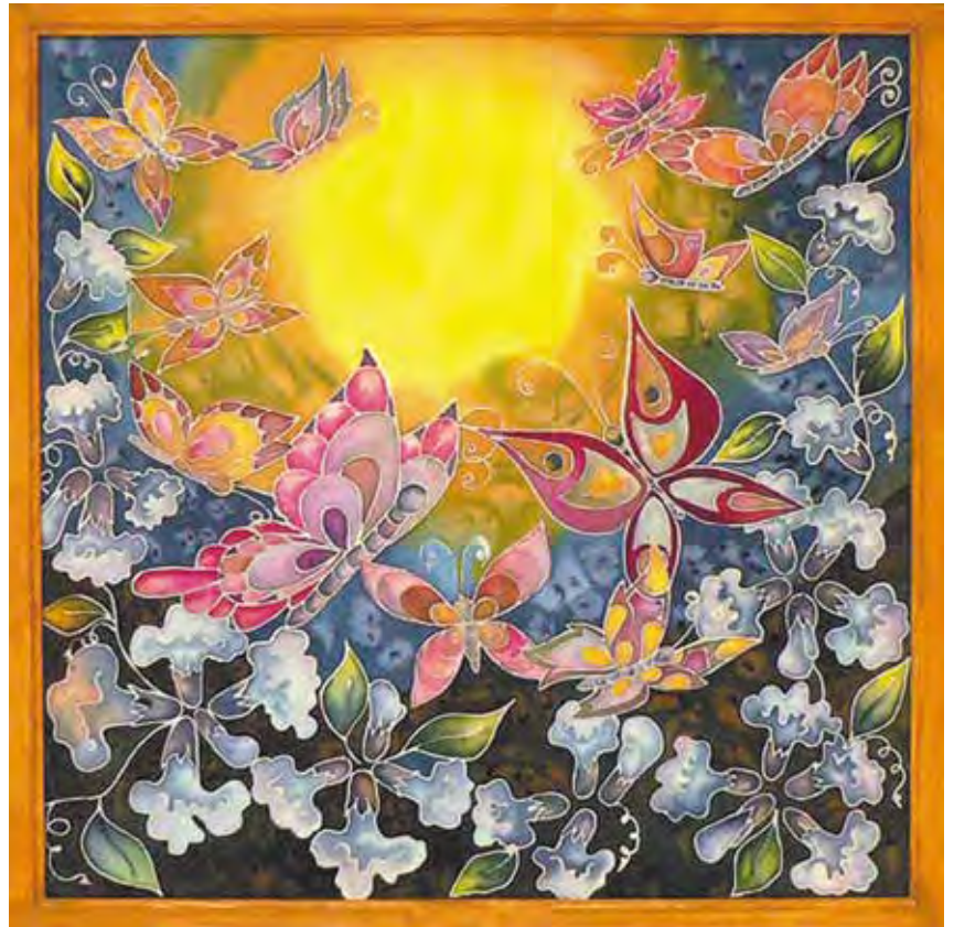
«Бабочки», батик Автор – Екатерина Калина, г. Сальск