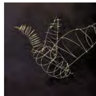
«Летающий голубь», скульптурная композиция Автор – Джереми Ли, г. Шанхай

формационные продукты и разослать награды почтой. Напротив, в финансовом плане такие расходы для нас неподъемны. Объяснение простое: сегодня творчество детей и молодежи не каждому спонсору интересно. Но есть надежда, что в будущем «Океан дружбы и мечты» найдет поддержку, генерального спонсора и благотворителей. Новое — то, что в этом году мы поставили перед собой задачу охватить как можно большее количество участников из нашей страны. Это удалось, стоит только ознакомиться с цифрами и фактами фестиваля. Мы также впервые предложили тему «Сказки народов Дальнего Востока РФ и стран Тихого океана», поощрив исследовательский и читательский азарт конкурсантов, открывших для себя не только сказочных героев Кореи, Китая, Японии, Дальнего Востока России, но и костюмы, орнамент, обычаи народов нашего региона.