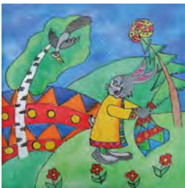
«Сорока и заяц», батик Автор – Дарья Егорова, пос. Хор