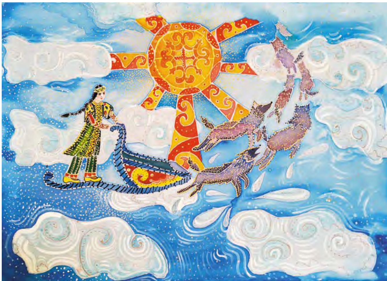
«Путешествие Эльги», батик Автор — Мария Астахова, г. Свободный

В этом году программа включает: конкурс работ по декоративно-прикладному искусству (по настоятельным просьбам любителей этого жанра) и введение номинации «Свободная тема»; выпуск разделов интернет-программы «Многообразие культур объединяет»; издание иллюстрированного календаря по результатам фестиваля. Новое — то, что организаторы (кроме «Детей и взрослых» это кафедра педагогики ДВГТУ и ООО «Диджитал Стайл») проводят фестиваль без какой-либо спонсорской поддержки. Вовсе не потому, что нам ничего не стоит обеспечить дизайнерские работы, приобрести призы, изготовить рекламно-ин-