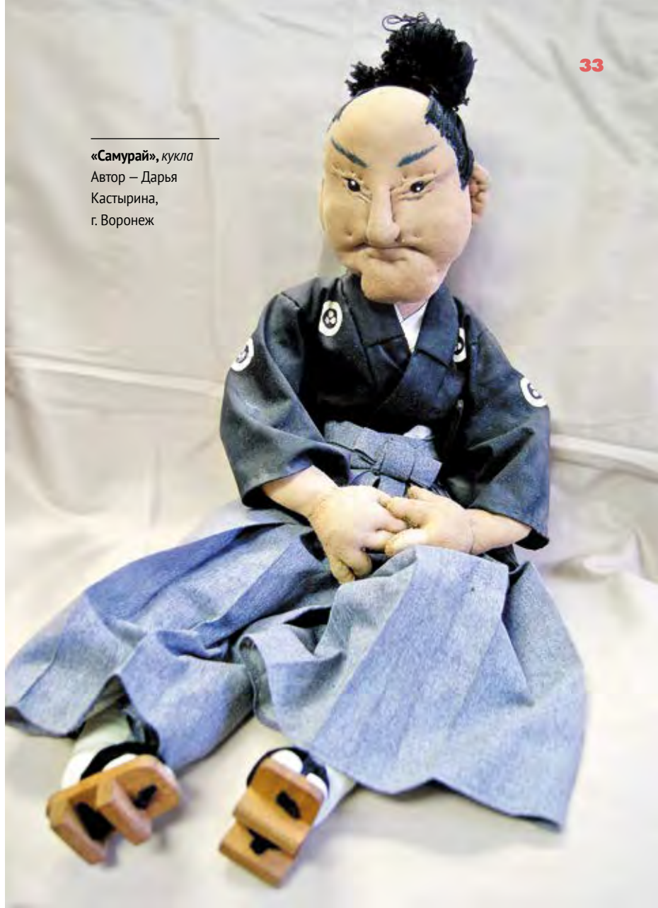
«Самурай», кукла Автор – Дарья Кастырина, г. Воронеж

РАСШИРЯЯ СОЦИОКУЛЬТУРНОЕ ПРОСТРАНСТВО ДЛЯ ТВОРЧЕСКОГО РАЗВИТИЯ, ДРУЖБЫ И ОБЩЕНИЯ В СООБЩЕСТВЕ ДАЛЬНИЙ ВОСТОК РОССИИ — АТР, ФЕСТИВАЛЬ «ОКЕАН ДРУЖБЫ И МЕЧТЫ» СОДЕЙСТВУЕТ МЕЖКУЛЬТУРНОМУ ОБРАЗОВАНИЮ, ИНТЕРНАЦИОНАЛЬНОМУ И ПАТРИОТИЧЕСКОМУ ВОСПИТАНИЮ ДЕТЕЙ И МОЛОДЕЖИ И ОКАЗЫВАЕТ ПОДДЕРЖКУ В ИХ ТВОРЧЕСТВЕ