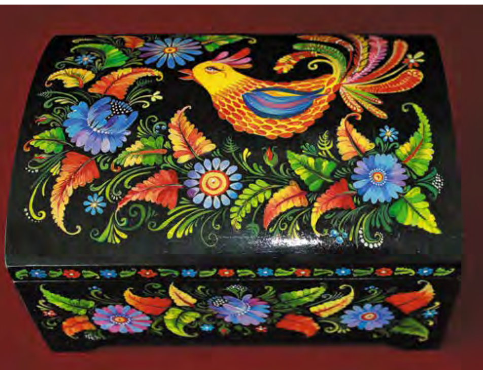
«Золотой петушок», роспись по дереву Автор – Кристина Коваленко, с. Милоградово (г. Уссурийск)

РАСШИРЯЯ СОЦИОКУЛЬТУРНОЕ ПРОСТРАНСТВО ДЛЯ ТВОРЧЕСКОГО РАЗВИТИЯ, ДРУЖБЫ И ОБЩЕНИЯ В СООБЩЕСТВЕ ДАЛЬНИЙ ВОСТОК РОССИИ — АТР, ФЕСТИВАЛЬ «ОКЕАН ДРУЖБЫ И МЕЧТЫ» СОДЕЙСТВУЕТ МЕЖКУЛЬТУРНОМУ ОБРАЗОВАНИЮ, ИНТЕРНАЦИОНАЛЬНОМУ И ПАТРИОТИЧЕСКОМУ ВОСПИТАНИЮ ДЕТЕЙ И МОЛОДЕЖИ И ОКАЗЫВАЕТ ПОДДЕРЖКУ В ИХ ТВОРЧЕСТВЕ