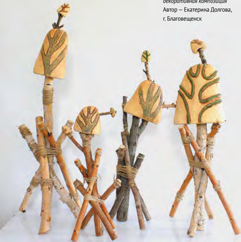
«Глухомань», декоративная композиция Автор – Екатерина Долгова, г. Благовещенск