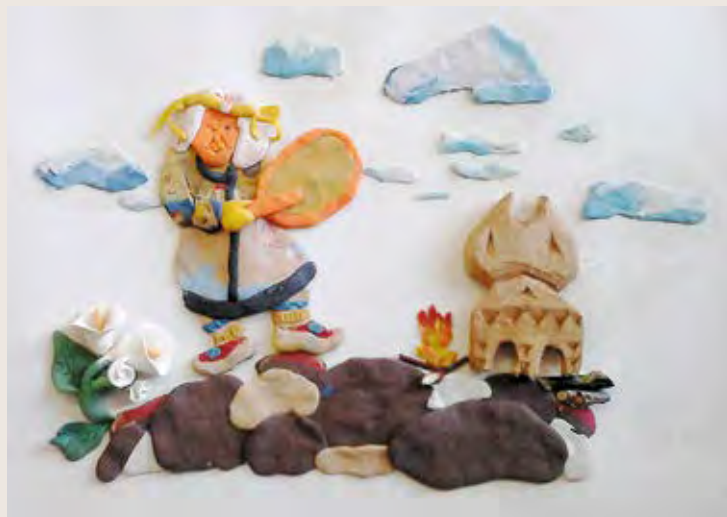
«Камлание», полимерная глина, дерево Автор — Анастасия Меднева, г. Хабаровск

кий человек быстро повесил топор над входом в юрту и вышел. Все уехали верхом на оленях, за ними ушел и весь табун. В стойбище осталась лишь юрта, где жил Болчан.