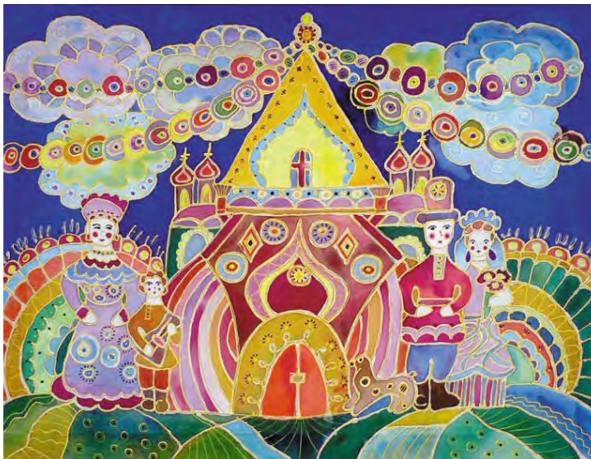
«Ярмарка», батик Автор – Любовь Глазунова, г. Сальск