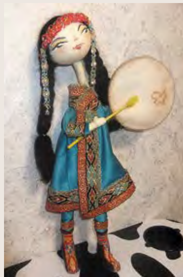
«Улэкэн», кукла Автор – Ульяна Гутник, г. Комсомольск-на-Амуре