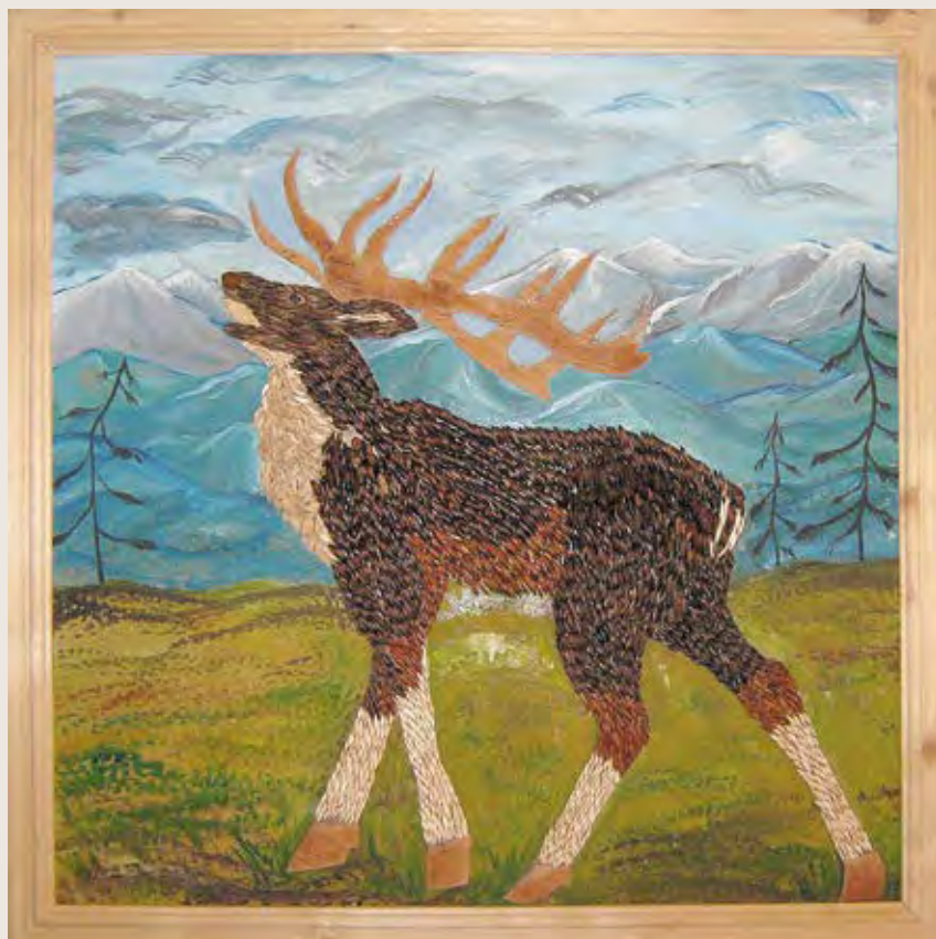
«На просторе», панно Автор — Анастасия Усова, с. Красное (Николаевский район Хабаровского края)

том он заснул крепким сном, а проснулся, когда первые лучи солнца стали проникать в дырочки юрты.