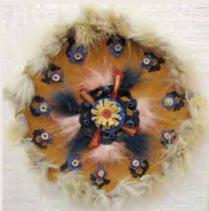
«Эскимосское солнце», изделие из меха Автор — Денис Галкин, г. Нижний Тагил