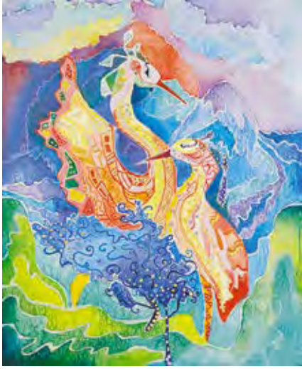
«Величие белых цапель», батик Автор – Яна Бугрий, г. Свободный