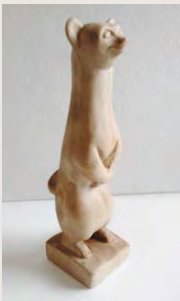
«Ласка», дерево Автор — Алена Красивых, г. Хабаровск