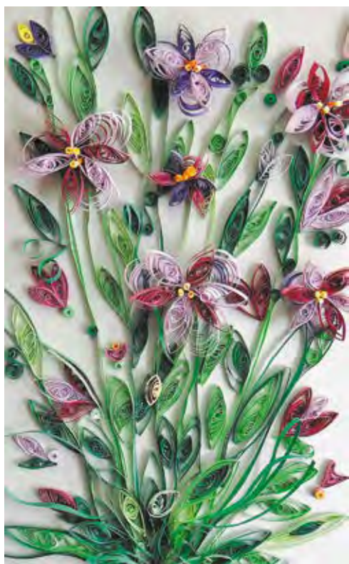
«Дикоросы Приамурья», квиллинг Автор — Сусанна Азизбеян, г. Хабаровск