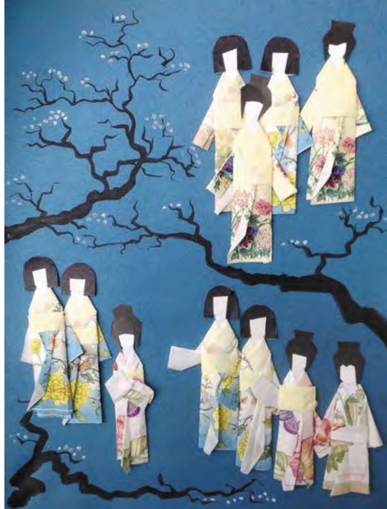
«Под вишней в цвету», панно Автор – Полина Гучапшева, г. Нижний Тагил