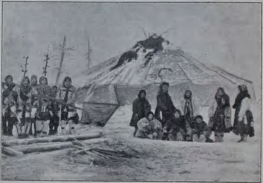
Зимняя ураса у края лѣсовъ семьи княздя 1-го Алазейскаго юкагирскаго рода и его отца. Направо—женщины, налѣво—мужчины съ луками и стрѣлами.

Главный обмѣнъ между тундренными людьми и русскими и якутскими торговцами производится на ярмаркѣ на Дулбѣ. Это мѣсто на тундрѣ между рр. Б. Чукочьей и Колымой. Туда въ октябрѣ мѣсяцѣ прикочевываютъ бродячіе роды, прїѣзжаютъ торговцы для обмѣна, исправникъ для полученія ясака и походный священникъ для совершения требъ. Я не буду распространяться о характерѣ мѣновыхъ сношеній. Болѣе или менѣе они извѣстны. Они основаны на кредитѣ, на переходѣ долговыхъ обязательствъ по наслѣдству, такъ что каждый