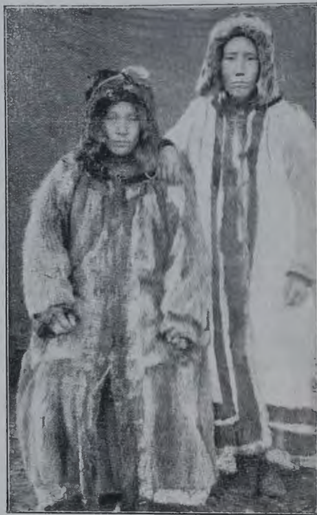
Якутки края Лѣсовъ въ праздничныхъ костюмахъ.

нымъ мной даннымъ, большинство браковъ совершается не только внутри наслега (административная единица, обнимающая большее или меньшее количество родовъ), но и между однофамильцами, что указываетъ на ихъ кровное родство. Большинство притундренныхъ якутовъ не знало названія рода, отъ котораго они происходятъ. Вопросъ этотъ ихъ теперь уже не интересуетъ. Только по архивнымъ бумагамъ старыхъ ревизскихъ сказокъ, я собралъ свѣдѣнія о количествѣ родовъ въ каждомъ наслегѣ, объ ихъ названіяхъ и о томъ, изъ какого именно рода происходятъ опрошенные мной якуты. Этимъ объясняется, почему г. Строщевскій въ своемъ трудѣ о якутахъ для полярныхъ якутовъ слилъ понятіе наслега и рода, отмѣтивъ въ каждомъ наслегѣ только одинъ родъ. Перѣдки также тамъ сожительства въ такихъ степеняхъ родства, которыя не могутъ быть освящены церковью.