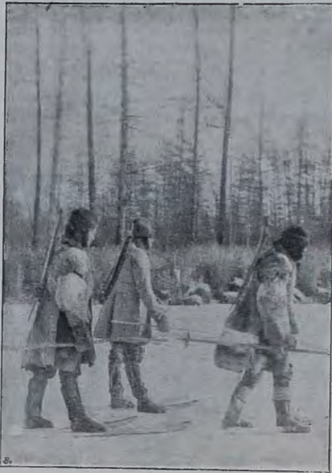
Охота Верхне-Колымскихъ юкагировъ на оленей по насту на лыжахъ (см. статью: «По рр. Ясачной и Коркодону»).

Интересно указать тутъ, что тундренные охотники употребляютъ еще на охотѣ главнымъ образомъ оружіе костяного вѣка—лукъ и стрѣлы, въ то время какъ у верхнеколымскихъ юкагировъ и лѣсныхъ тунгусовъ мы уже находимъ почти исключительно кремневую винтовку. Отсталость тундреннаго охотнива объясняется не одной недоступностью для него оружія желѣзнаго вѣка, а также отсутствіемъ на тундрѣ бѣлки, для промысла которой необходимо ружье.