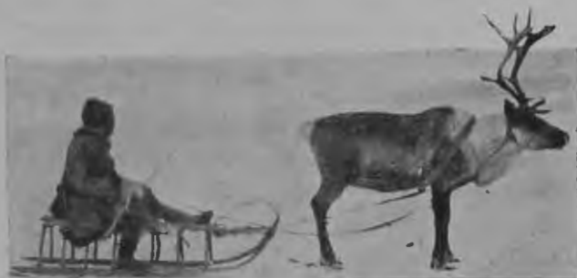
Тундренный тупгусъ на бѣговыхъ санкахъ.

Кромѣ внѣшняго обмѣна еще производится на тундрѣ внутренней обмѣнъ, по приобрѣтенію предметовъ не привознаго, а мѣстнаго происхожденія. Такъ напр. привозятъ изъ лѣсной полосы на ярмарку березовое дерево для полбзевч и копыльевъ нарты, осиновыя доски для челноковъ и лиственничную стѣру для заливанія швовъ челпка; чукчи привозятъ оленьи жилы на нитки, тюленьи и моржевые ремни для связыванія частей нарты; якуты — коровьи ремни и конскій хвостовой волосъ на сѣти, чаще всего готовыя сѣти. Въ обмѣнъ на эти вещи идетъ пушнина, оленьи шкуры, оленье мясо, рыба, дичь, мамонтовая кость и даже тундренная морошка, которую доставляютъ русскимъ въ Средне-колымскѣ.