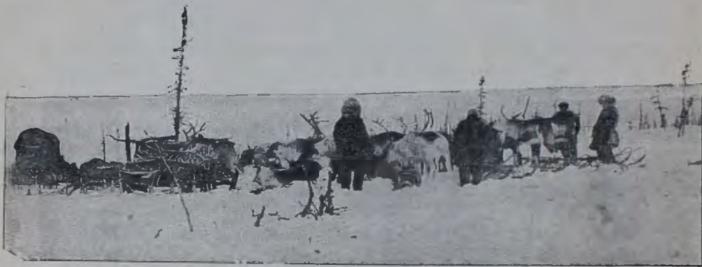
Мой переѣздъ съ р. Алазея на р. Герченъ. Чукчи-ямщики собираютъ утромъ на ночлегѣ оленей, чтобы отправиться въ дальнѣйшій путь.

Кромѣ того чукотскій домашній олень захватомъ кормовищъ, вытѣснилъ полевого. Тунгусы говорятъ, что дикій олень убѣжалъ отъ домашняго, какъ послѣ пала, и ушелъ на острова. Въ промыслѣ песцовъ молодые чукчи начинаютъ конкурировать съ другими бродячими людьми.