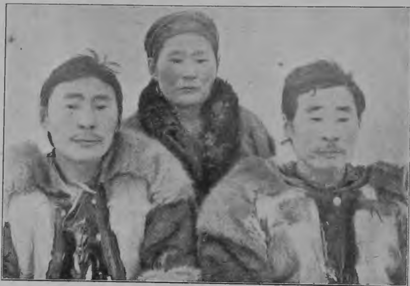
Средній братъ Князца. Жена Князца (ламутка). Князецъ 1-го Алазейскаго юкагирскаго рода.

съ пуда. Вѣсть объ этой находкѣ скоро распространилась по всему округу. Старика, отца князя, различные торговцы соблазняли самыми выгодными предложеніями для мѣны, но вѣрный своему постоянному заимодавцу, одному разбогатѣвшему торговлей среднеколымскому казаку, онъ выждалъ его прїѣзда на тундру. Чтобы устранить сразу всѣхъ конкурентовъ, послѣдній, не упоминая о долгахъ, предложилъ за кость наличныя деньги, товаръ, который весьма дорого цѣнится въ округѣ. Въ виду наличности сдѣлки и старыхъ сношеній сошлись на 100 руб. Получивъ такую кучу денегъ, старый юкагиръ былъ въ восторгѣ. Онъ мечталъ уже о дешевой покупкѣ на деньги чаю и табаку, объ уплатѣ за всѣхъ родовичей ясаку и о полученіи взаменъ этого съ послѣднихъ съ выгодой для себя песцовъ. Послѣ угощенія водкой торговецъ рѣшилъ, что деньги ему нужно получить обратно и началъ въ искусной рѣчи излагать хозяину, какъ онъ, купецъ, всегда вѣрилъ ему, всегда былъ добръ къ нему, никогда не отказывалъ ему въ кредитѣ, всегда откладывалъ платежи; напомянулъ ему, какъ онъ обѣщалъ не разъ заплатить осенью часть долга и такъ какъ онъ теперь имѣетъ