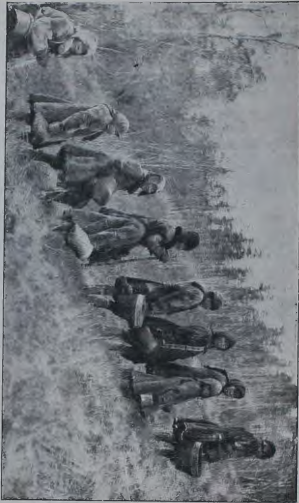
Верхне-юконскіи юкагиры отпращиваются по ямдам.

Замѣчу мимоходомъ, что юкагирская система родства вполне похожа на системы родства американскихъ индѣйцевъ, приведенныя Морганомъ. Старшій