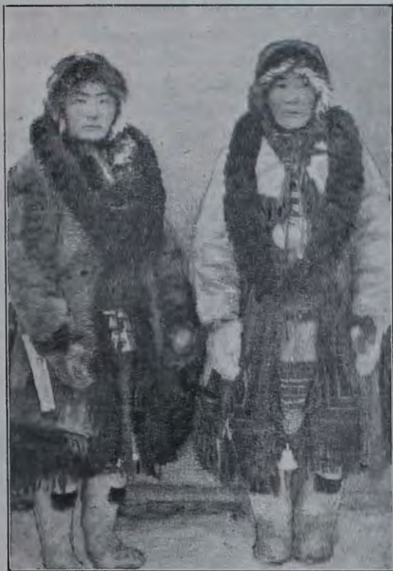
Жена и сестра (ламутка) Князца I-го Алазейскаго юкагирскаго рода.

Для иллюстраціи мѣнновыихъ отношеній я расскажу объ одной характерной сдѣлкѣ, имѣвшей мѣсто на тундрѣ передъ самымъ моимъ прїездомъ туда. Въ томъ году повезло семейству князца I-го алазейскаго рода. У князца есть еще два брата—лучшіе промышленники на тундрѣ и старикъ отецъ. Это самое почетное и богатое семейство на тундрѣ. Богатство ихъ заключается въ оленяхъ—у князца вмѣстѣ съ отцомъ ихъ около 100, затѣмъ въ числѣ и качествѣ промышленниковъ и наконецъ въ количествѣ наслѣдственныхъ и благопріобрѣтенныхъ долговъ. Степень задолженности тоже служитъ мѣриломъ