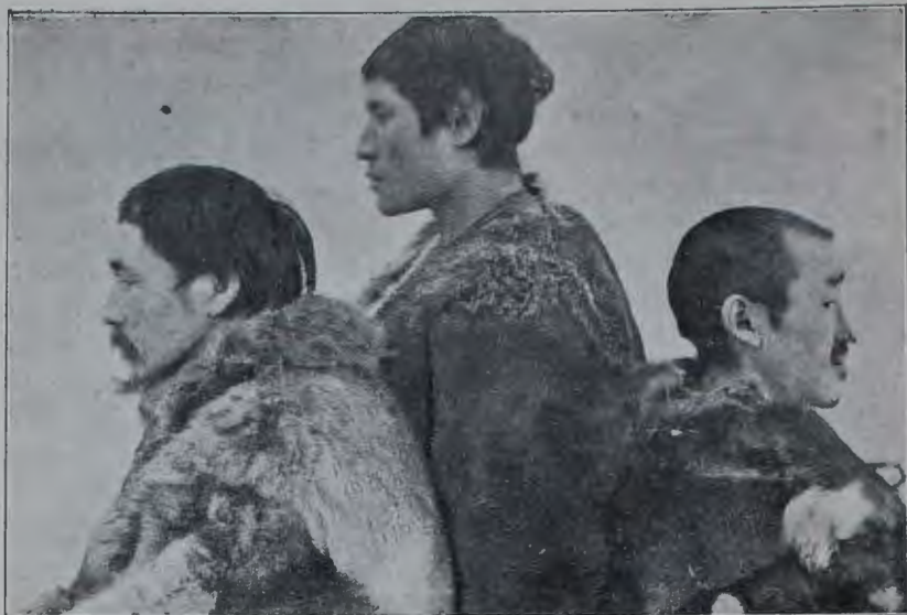
Типы чукочъ съ рѣки Юрченъ (профиль).

жить какъ со стороны Алазеи, такъ и со стороны Индигирки по отрогамъ хребта, который служитъ водораздѣломъ этихъ рѣкъ и главная ось котораго