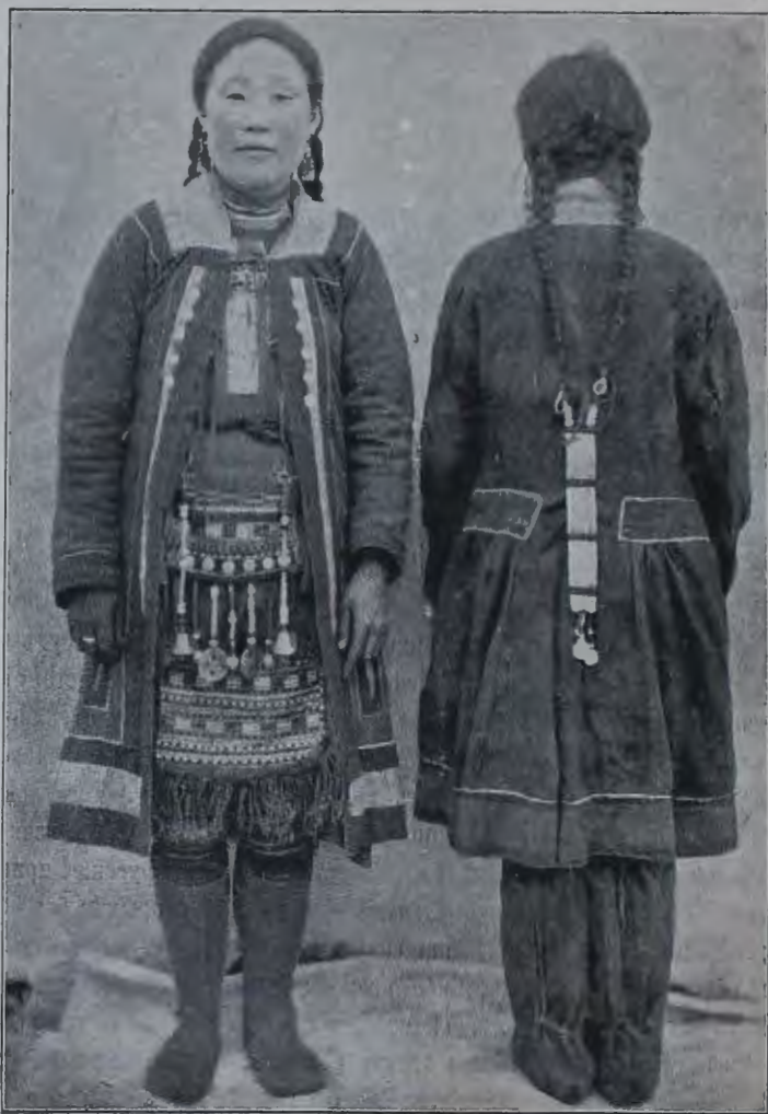
Двѣ юкагирскихъ молодыхъ дѣвушки съ рѣки Ясачной въ лѣтнихъ костюмахъ.

товомъ видѣ. Съ отдѣльными родами юкагирскаго племени, родами, разбросанными на громадномъ разстояніи другъ отъ друга между р.р. Колымой и Яной, я жилъ и странствовалъ болѣе двухъ лѣтъ. Моей второстепенной экспедиціон-