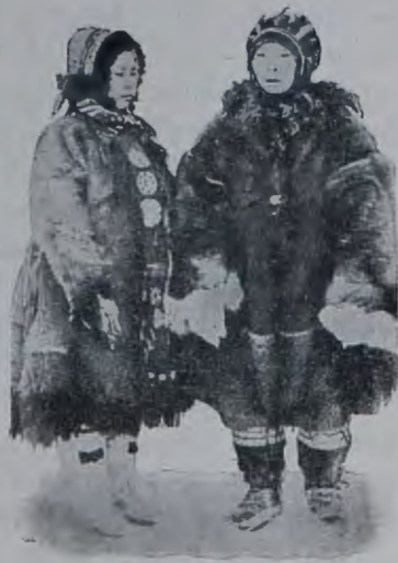
Тундренныя тунгуски въ тунгузскомъ въ чукотскомъ костюмѣ. костюмѣ.

Обратившись къ сватовству и браку тундренныхъ родовъ, мы увидимъ, насколько въ нихъ тунгузскій элементъ уже смѣшанъ съ юкагирскимъ. Какъ изъ верхнеколымскаго сватовства, а я изъ записаннаго мной текста сватовства на