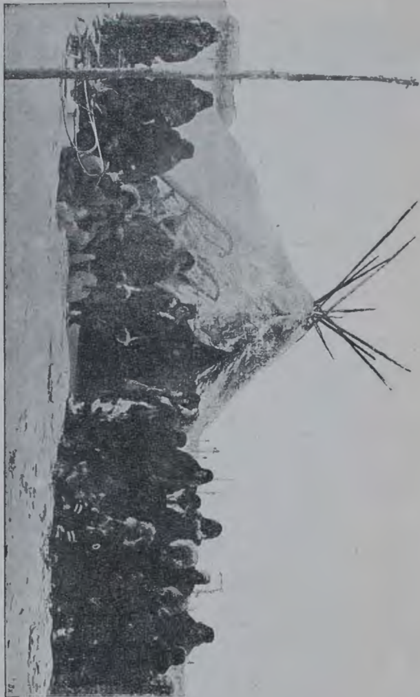
Терпеновѣ чурчи и ихъ жилище.

назадъ оленей, доставшихся имъ изъ калыма. Этотъ обычай такъ и называется нягмар мэнга т. е. обратно взяли.