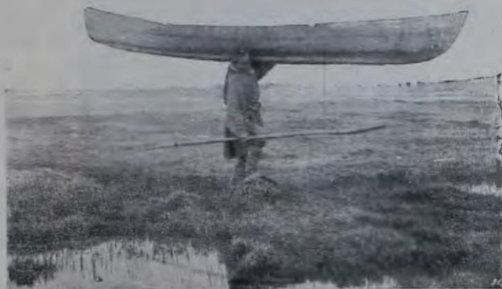
Тундренный рыбакъ переноситъ свой челнокъ изъ одного озера въ другое.

Въ рѣкахъ встрѣчается «бѣлая рыба» нельма, омуль, муксунъ, въ озерахъ чирь, пелядь, шокоръ — это все различные виды Coregonus т. е. сига. Въ озерахъ, ближайшихъ къ морю, явѣтся красная рыба «краска», одинъ изъ видовъ Salmo , кромѣ того водятся въ озерахъ щука, налимъ. Тундренные озерные чирь ( Coregonus nasutus ) подъ названіемъ Алѣрскихъ, отъ имени двухъ озеръ—Большого и Малаго Алѣрскаго, славятся вкусомъ во всемъ краѣ. Промышляютъ тундренные люди рыбу сѣтями изъ конскихъ волосъ, вывѣжая въ легкихъ челнокахъ изъ тонкихъ осиновыхъ досокъ, называемыхъ тамъ вѣтками. При переходѣ лѣтомъ отъ одного озера къ другому тундренные рыбаки волокутъ за собой челноки по мокрому мшистому грунту, точно санки, или переносятъ ихъ на плечахъ черезъ болота и кочки.