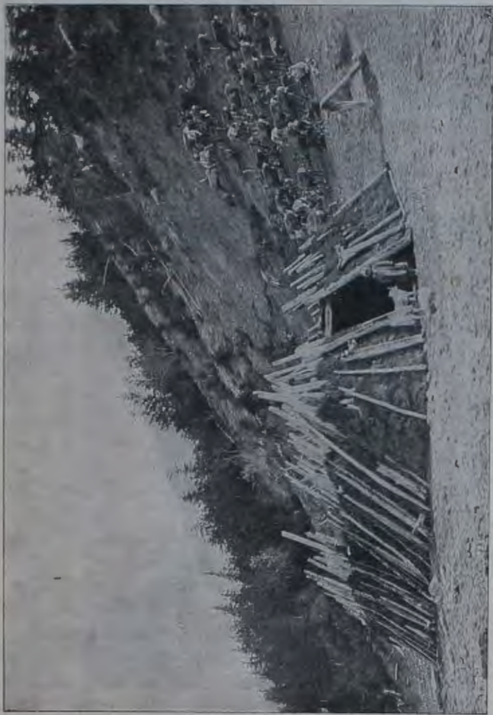
Хозяйство якута-оленевода, въ низовьяхъ р. Лены.

дигиркой и Леной. Тамъ они лишились рогатаго скота, сдѣлались оленеводами или, по близости отъ моря, собаководами, но надо замѣтить, что они выработали тамъ своеобразный типъ оленеводства. Вернувшись къ Колымскимъ якутамъ, мы съ другой стороны можемъ утверждать, что не только климатическія условія повліяли на измѣненіе типа хозяйства, сравнительно съ хозяйственнымъ бы-