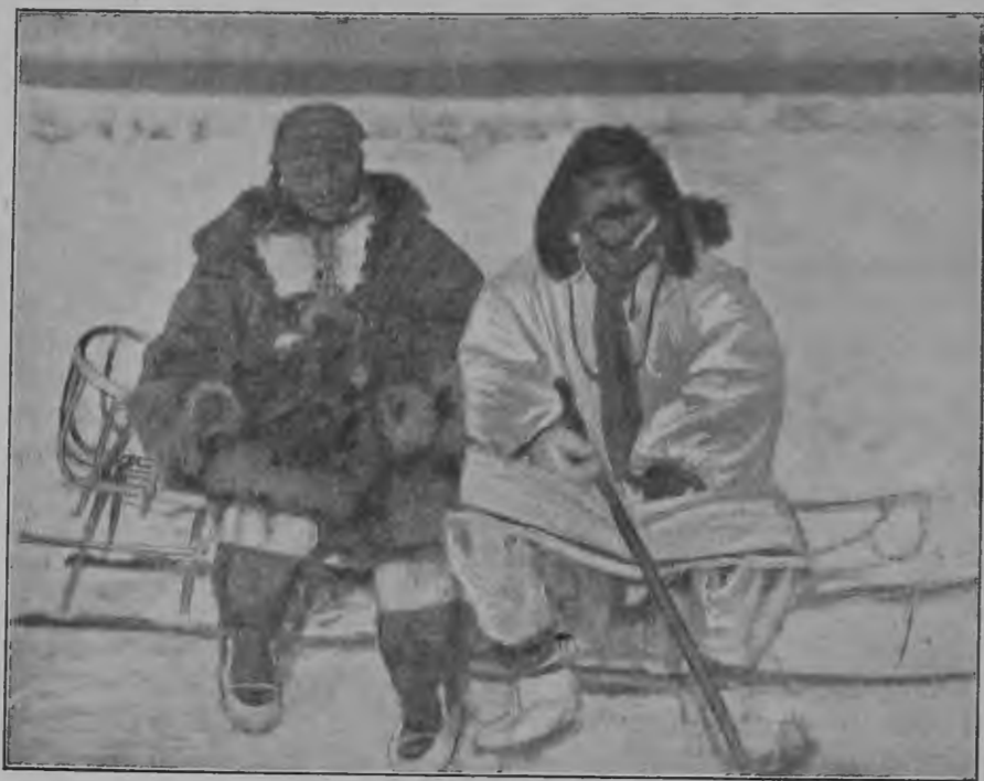
Чукча съ чукчанкой съ восточнаго берега р. Колымы.

Чтобы закончить свой доклад о бродячих родах тундры необходимо, прибавить кое что об их отношеніях съ одной стороны къ якутамъ, съ другой къ чукчамъ. Духовное вліяніе якутовъ на эти роды выражается въ томъ, что по якутски они всё говорятъ, какъ по юкагирски. Въ Якутской области якутскій языкъ является международнымъ языкомъ. Но физически якуты рѣдко смѣшиваются съ тундренными людьми. Въ числѣ замужнихъ женщинъ на тундрѣ я не нашелъ ни одной якутки точно также якуты рѣдко берутъ тундренныхъ дѣвушекъ.