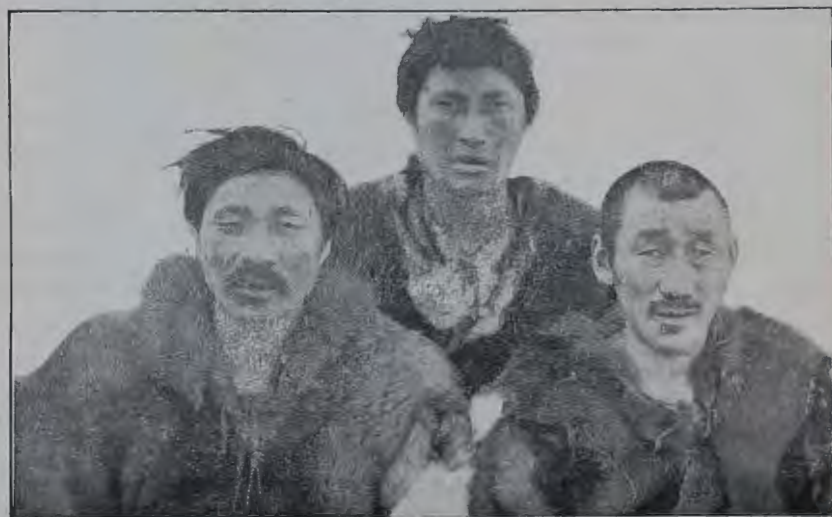
Типы чукочъ съ рѣки Юрченъ (фасъ).

тянется діагональю между среднимъ теченіемъ Индигирки и нижнимъ Алазеи. Мѣстность состоитъ изъ голыхъ отроговъ, лишенныхъ растительности. Только