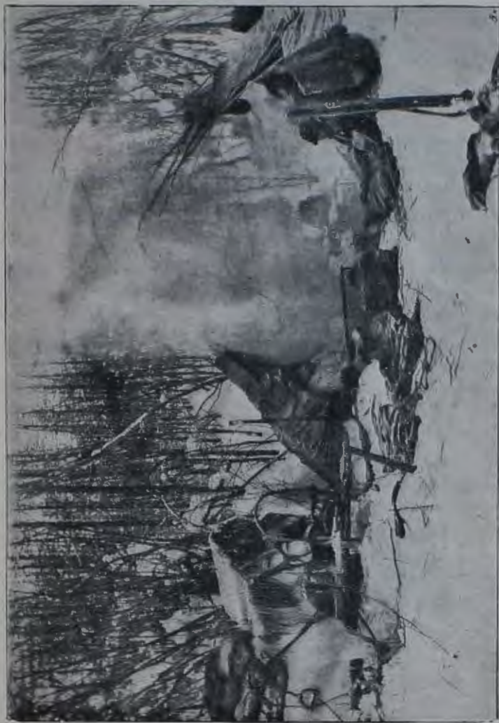
Номлеги на снѣгу на берегу р. Корюдона (см. статью: «По рр. Ясаичной и Корюдону»).

ками и чулчакками. Впрочемъ, только одно свадебное дѣйствіе—обмѣнъ подарками, символически можетъ еще представлять мировую, но мы почти ужъ не видимъ другихъ пережитковъ похищенія. За невѣстой приходитъ одна сваха, а не вооруженный поѣздъ родственниковъ жениха, какъ у якутовъ, родственники невѣсты стрѣляютъ въ злыхъ духовъ, а не въ похитителей, подарки даютъ