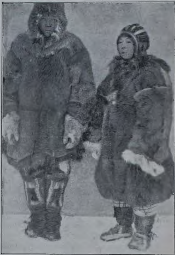
Чукча съ женой юкагиркой въ чукотскомъ костюмѣ.

Согласно преданіямъ, надо думать, что сватовство у юкагировъ есть институтъ позднѣйшаго времени, заимствованный у пришлыхъ племенъ, приобретающихъ невѣсту куплей, а также у русскихъ. Въ старину, разсказываютъ,