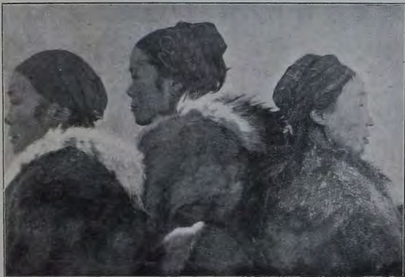
Чукчанки съ р. Іерченъ (профиль).

брака, названнаго г. Богоразомъ перемѣннымъ бракомъ и заключающагося въ