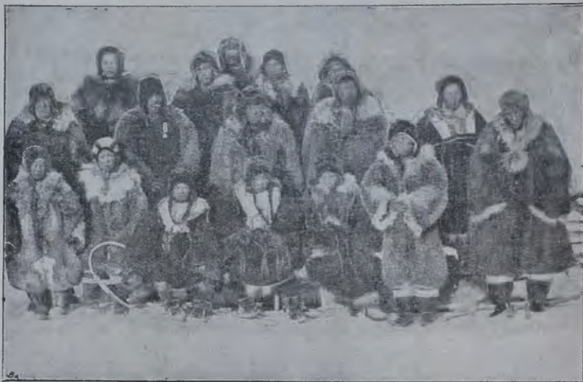
Группа Иерченскихъ чукочъ.

своихъ женъ. Я спросилъ одного почетнаго тунгуса, сестра котораго передъ этимъ была отдана чукчамъ, будетъ ли его сестра жить со смѣшными товарищами мужа. «Поневоля́ будетъ, если мужъ прикажетъ», отвѣтилъ онъ. Известны случаи подчиненія этому обычаю русскихъ женщинъ, вышедшихъ за чукочъ, только якутки питаютъ такой страхъ передъ дикими нравами, образомъ жизни и брачными обычаями чукочъ, что и не знаю ни одного случая перехода якутской женщины въ чукотское стойбище. Я видѣлъ на урочищѣ Сенкель якутскую дѣвушку, проданную было ея дядей чукчамъ за 30 оленей, но, привезенная въ чукотскій лагерь, она сопротивлялась совершенною обрядомъ приобщенія ея къ семейному культу т. е. помазанію жертвенной кровью, си-