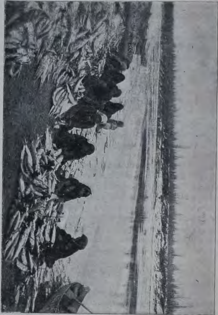
Юкагиря на р. Ясачной связываютъ, десятками огуемъ общественнаго промысла для дѣленія рыбы на цан (См. статью: «По рр. Ясачной и Кордогону». Изв. И. Р. Г. О. 1898 г. 3).

Якутское дѣленіе тунгусовъ на «морскихъ» и «горныхъ» можно назвать топографическимъ. Море и тундра, камень и хребетъ являются въ