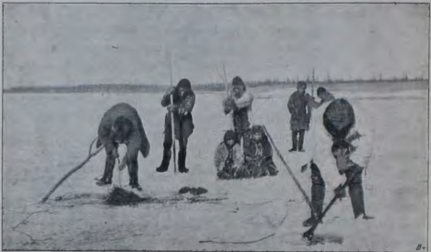
Подледный промыселъ рыбы юкагировъ на р. Ясачной. (см. статью: «По рр. Ясачной и Коркодону»).

Есть указанія на то, что на крайнем сѣверо-востокѣ въ недалекомъ еще прошломъ были мелкіе оленные роды, служившіе связью между юкагирами и чукчами. Къ нимъ можно причислить живущій еще остатокъ чуванскаго племени. Какой былъ у этихъ родовъ олень—неизвѣстно. Во всякомъ случаѣ теперешній тундренный домашній олень не чукотскій, а тунгусскій. Чукотскіе и тунгусскіе олени образуютъ по своимъ физическимъ свойствамъ двѣ вполне отличныхъ расы. Такимъ образомъ есть основаніе думать, что домашній олень пришелъ къ тундреннымъ юкагирамъ съ юга, вмѣстѣ съ тунгусами. Теперь же всѣ четыре рода—оленные люди. Но оленеводами въ строгомъ смыслѣ слова ихъ нельзя назвать. По произведенной мной на тундрѣ переписи оказалось,