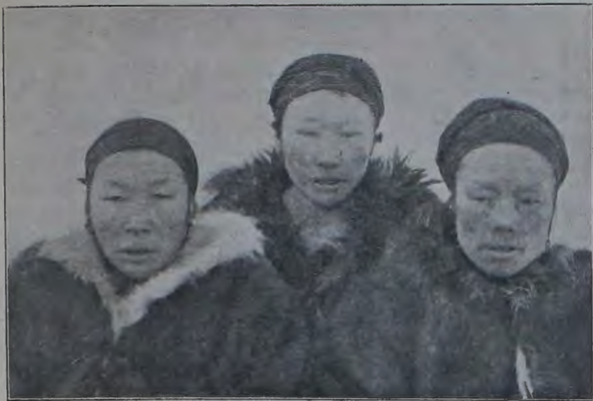
Чукчанки съ р. Іерченъ (фасъ).

гирки, перейдя въ домъ чукчи, должны одѣть чукотскій костюмъ, мѣнять образъ жизни и подчиняться требованіямъ чукотскаго полиандро-полигамическаго