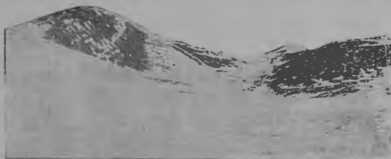
Виды гористой тундры.

цѣлаго племени. Это все были спутники приживальщики, присоединившіеся къ намъ подъ предлогомъ быть полезными въ качествѣ проводниковъ, но съ расчетомъ, что на ночевкахъ я ихъ не обдѣлю чаемъ и сухарями, а мои возчики чукчи—мясомъ.