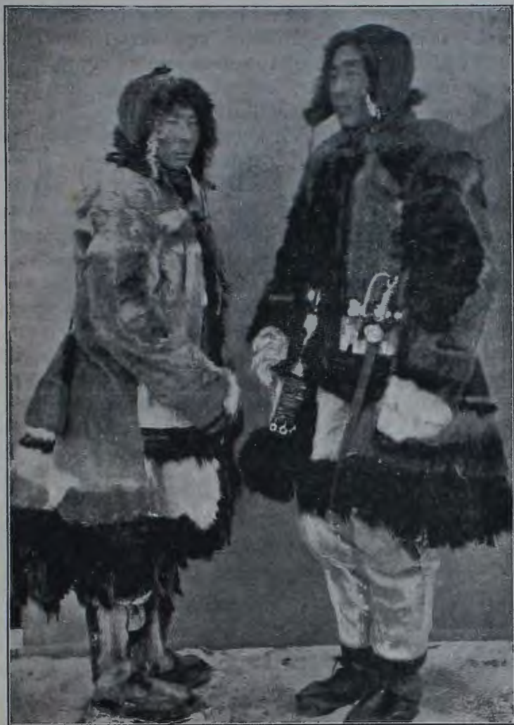
Младшій братъ князца перваго Алазейскаго юкагирскаго рода.

Тогда голова завѣдывалъ всѣми бродячими родами Полярной части Якутской области, т. е. онъ отвѣчалъ за ясакъ и доставлялъ въ русскія зимовья, такъ называемыхъ аманатовъ т. е. заложниковъ. Еще въ концѣ прошлаго вѣка Зашиверскія власти брали у бродячихъ инородцевъ въ залогъ дѣтей, чтобы