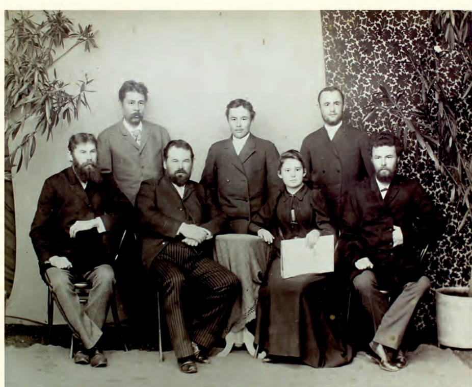
Штабъ Компаніи Амгунской Кербинской

Название села произошло от слова «веселиться». Расположенное на склоне небольшой горки, оно стало одним из самых популярных среди золотодобытчиков, быстро превратившись в златное место. В 1910 году здесь было официально зарегистрировано 14 кабаков и 8 опикурилен. Беспросветная нужда, тяжёлые условия труда и жизни толкали рабочих глушить своё горе в винном угаре. Их пьянство давало возможность хозяевам приисков получать дополнительную прибыль от торговли алкоголем, поэтому пьянство всячески поощрялось.