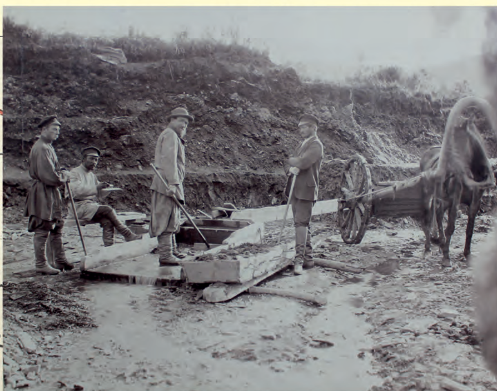
Выпуск с/б промывки приисков.

Причиной создания первых населённых пунктов в Приамгунье в 70-х годах XIX столетия, в которых селились пришедшие русские, стала добыча золота. В ту пору (в 1865 году) было разрешено и частное предпринимательство по золотодобыче на Дальнем Востоке. Поэтому здесь один за другим начали открываться прииски. Вблизи от нынешних Херпучей был основан Степанодмитриевский прииск, а чуть позже возникли прииски Владимирский, Софийский, Викторовский, Фёдоровский, Константиноеленинский, где селились люди, прибывшие даже из Забайкалья и Сибири.