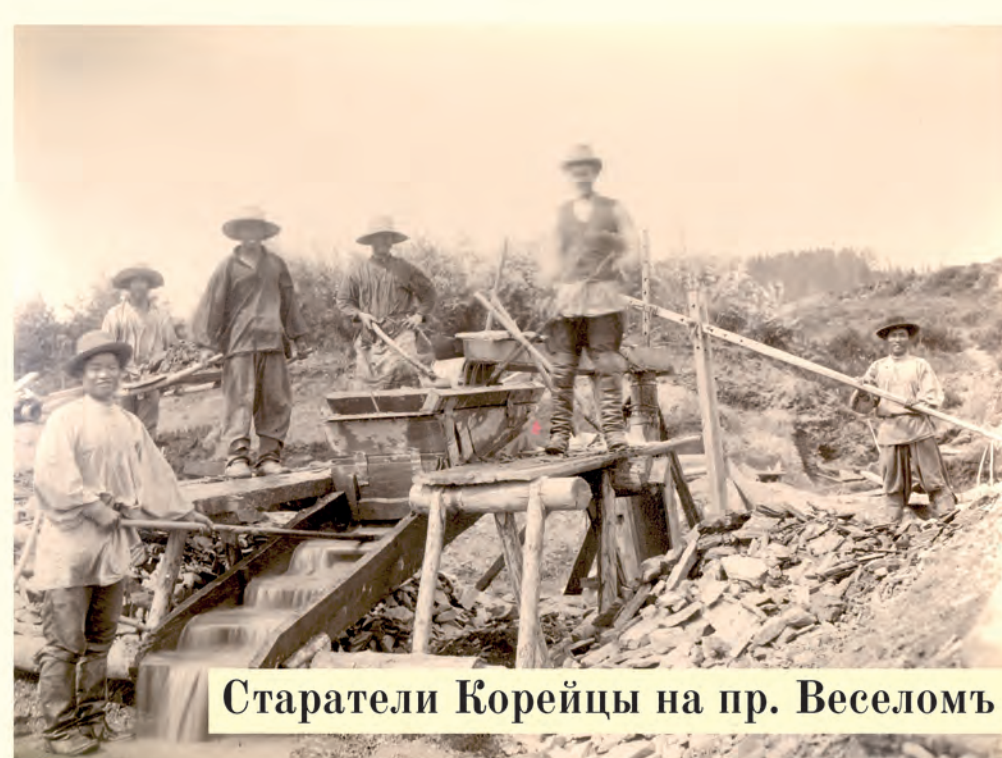
Старатели Корейцы на пр. Веселомъ

Предприимчивым руководителям золотодобывающих компаний надо было содержать людей. И вот в 1870 году на реке Амгунь, в устье её притока Уды, построили Удинский склад, в котором людей становилось всё больше с каждым днём. Так было положено начало современному Удинску.