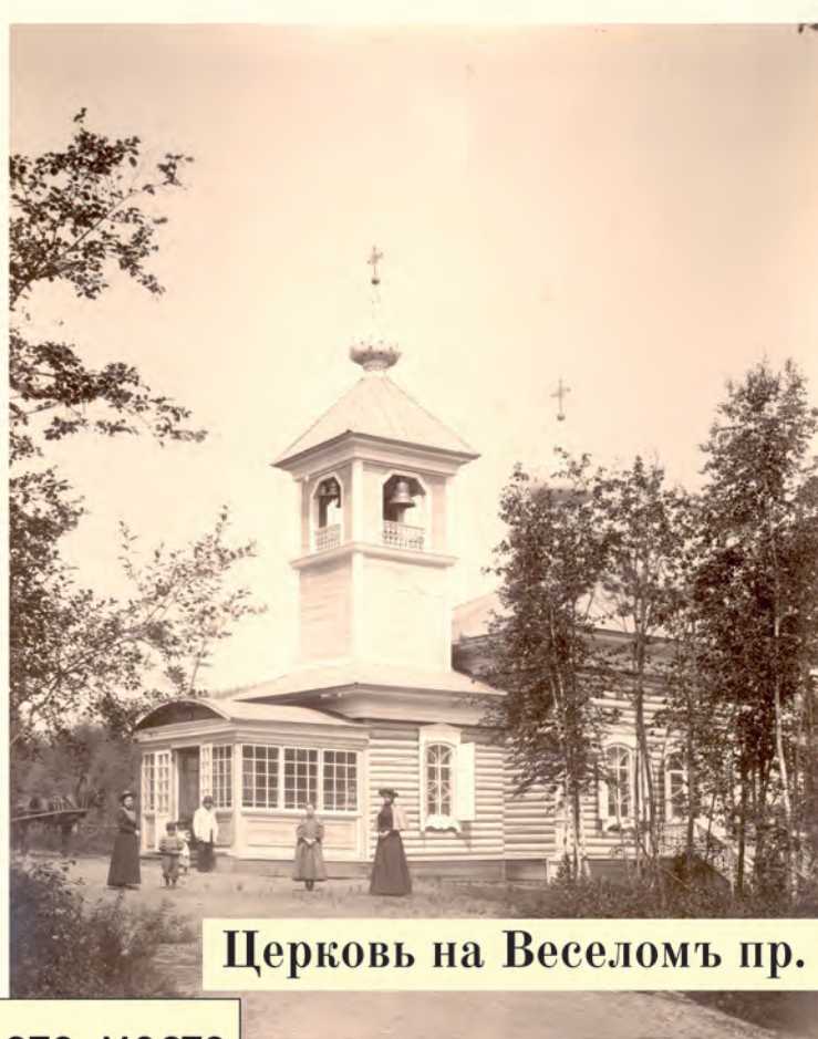
Церковь на Веселомъ пр.

В 1904 году Амгунской компанией на прииске Николаевском был открыт народный дом, но вследствие революционных выступлений рабочих в 1906 году это единственное культурное учреждение было закрыто.