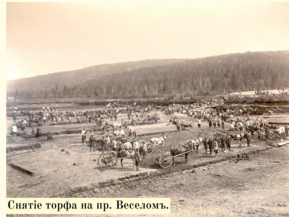
Снятие торфа на пр. Веселомъ.