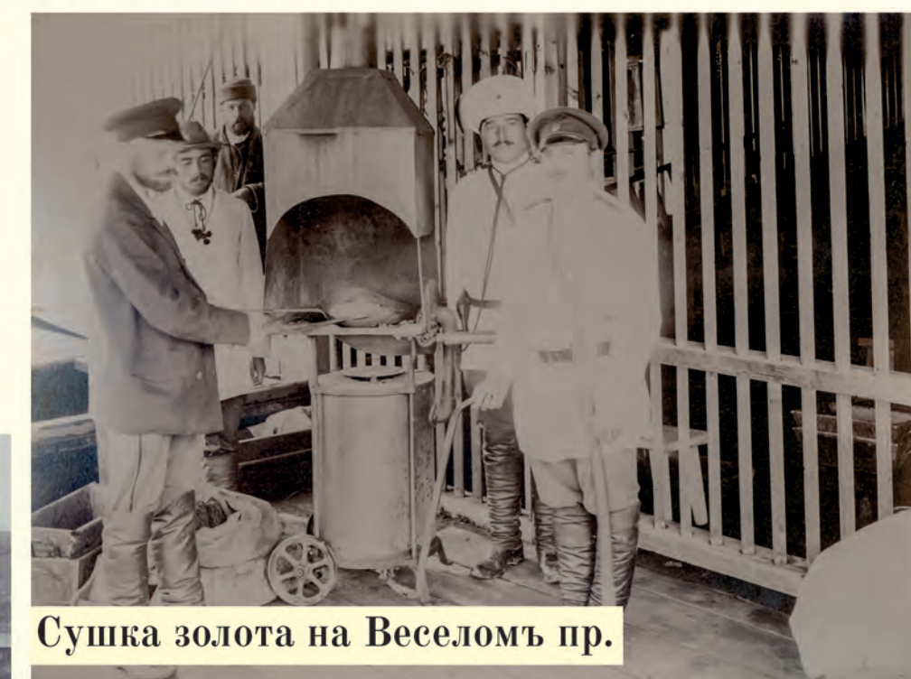
Сушка золота на Веселомъ пр.

Село Весёлая Горка было основано в 1870 году. Началось оно с одного барака на берегу реки Семи для участников поисковой партии. Но вскоре близлежащая территория была застроена, а село стало основным среди дореволюционных приисков Приамгунья.