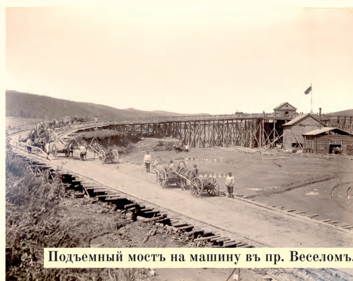
Подъёмный мостъ на машину въ пр. Веселомъ.