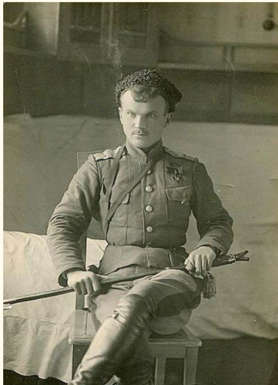
Войсковой атаман Уссурийского казачьего войска И. П. Калмыков

Казачьи и японские экспедиции ... действовали со зверской беспощадностью, уничтожая огнем и железом непокорное население Уссурийского края.