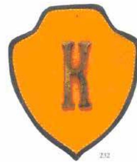
Нарукавный знак отряда Калмыкова

Отряд был сформирован в марте 1918 г. Через год преобразован в особый Уссурийский отряд атамана Калмыкова. В 1918–1920-х годах действовал на территории вдоль железной дороги от Никольск-Уссурийска до Хабаровска.