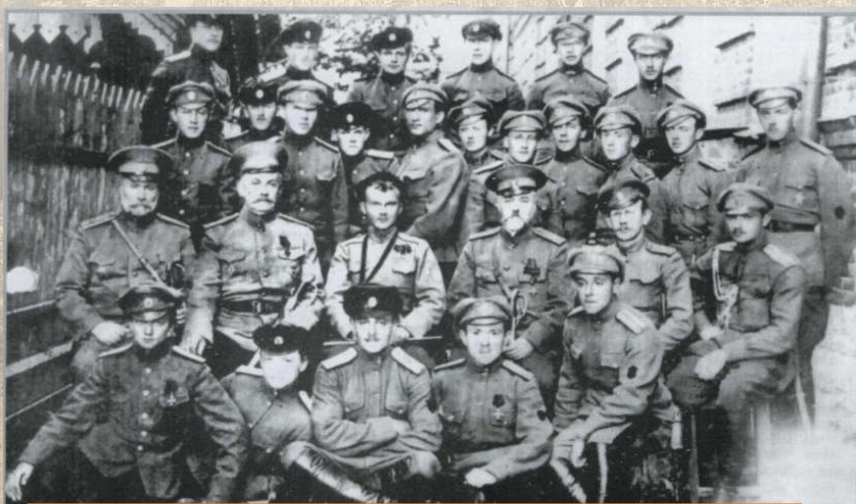
Первый выпуск Хабаровского имени атамана Калмыкова военного училища. Хабаровск 1918 г.