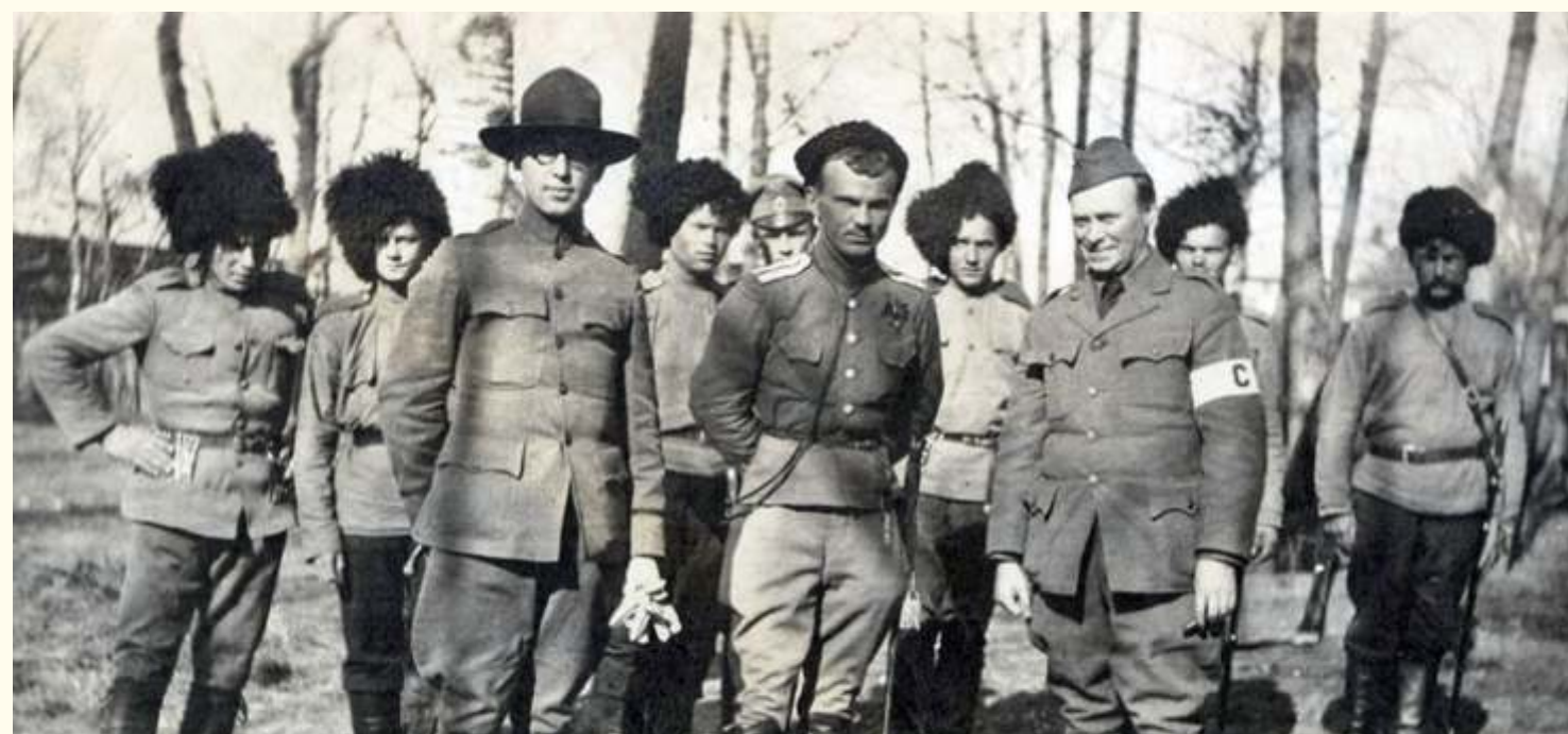
Атаман Калмыков с американскими журналистами. Хабаровск, октябрь 1918 г.

Желтый поезд Калмыкова время от времени курсировал от Хабаровска до Владивостока и обратно и «наводил» государственный порядок и спокойствие среди населения.