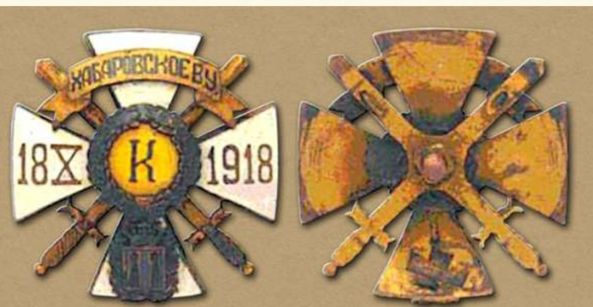
Знак Хабаровского Атамана Калмыкова военного училища

То была глухая, невыносимо гнетущая пора белого террора, расцвета белогвардейщины, бряцания шпор, блеска погон, чудовищной спекуляции и свиста бычачьих плетей — этой эмблемы атамановской власти.