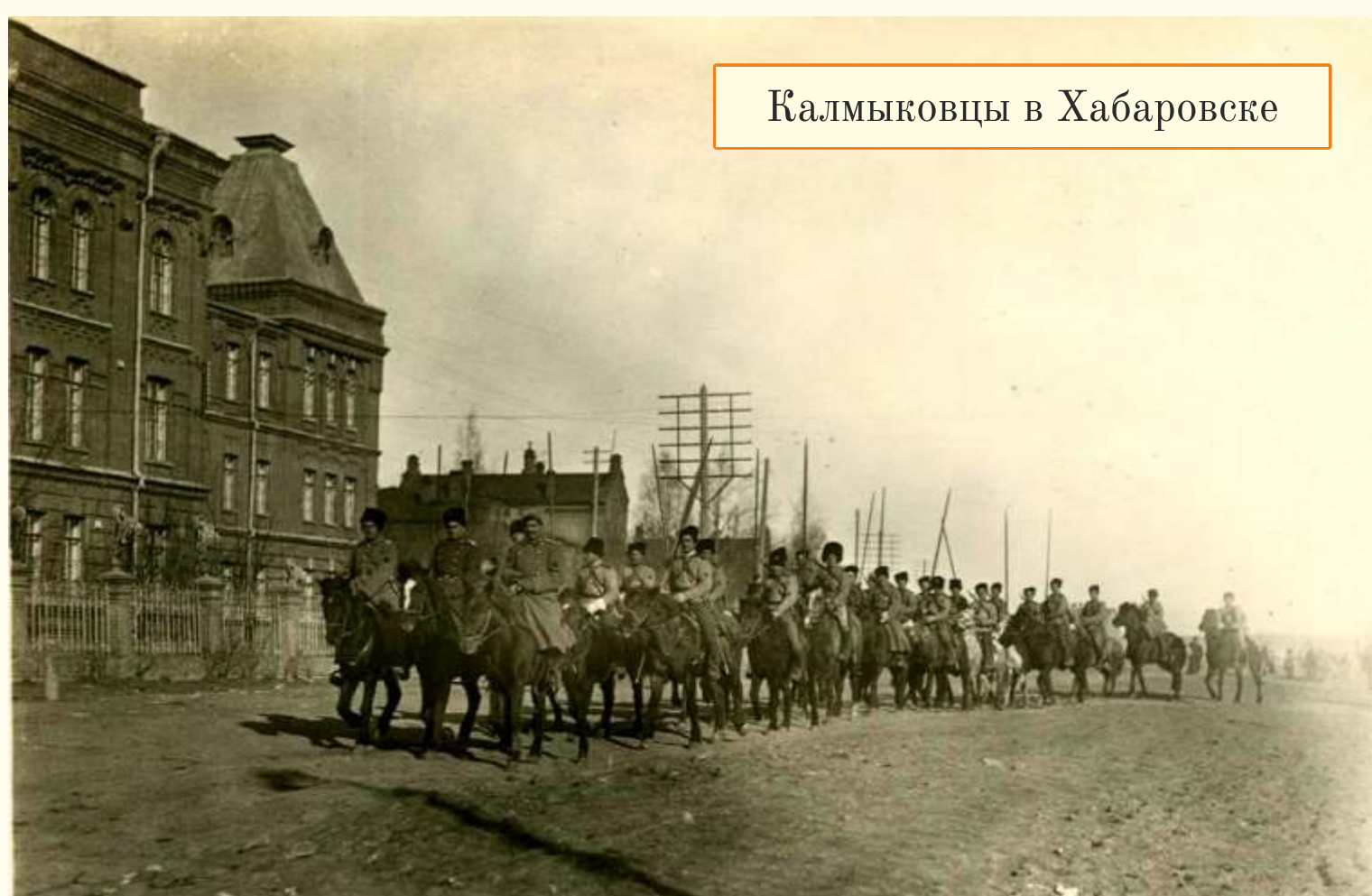
Калмыковцы в Хабаровске