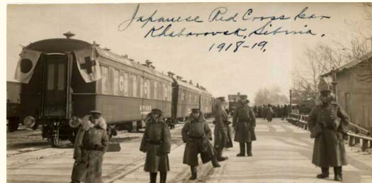
Японский поезд Красного креста, 1918-1919, Хабаровск.