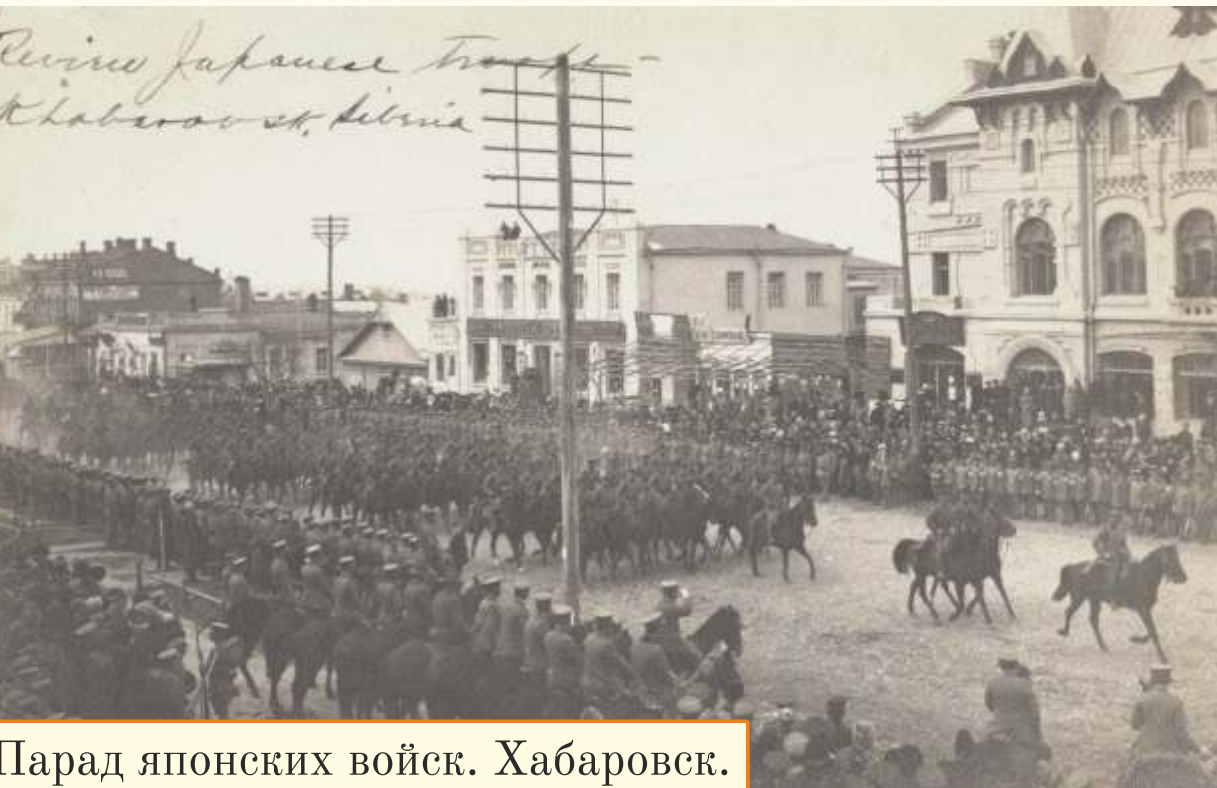
Парад японских войск. Хабаровск.