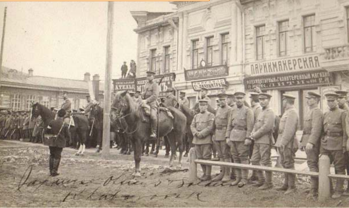
Японские офицеры в Хабаровске.