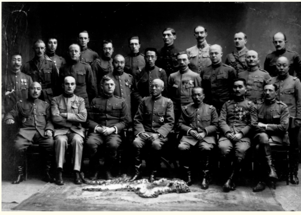
Американский генерал-майор Уильям С. Грейвс, генерал Кикудзо Отани и их штабы. 1918 г.