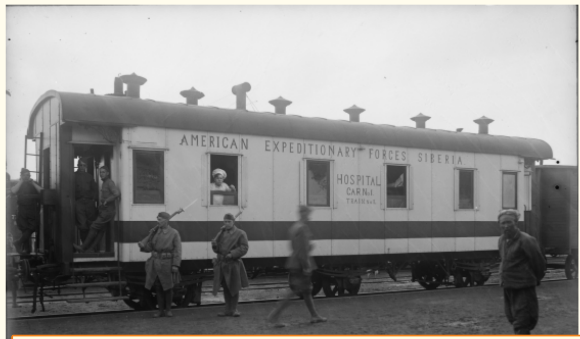
Передвижной госпиталь Американского Красного Креста.

Из газеты «Амурский лиман» за 1919 г.: «В Хабаровске 27-й американский пех. полк старается отучить японских солдат от бесчинств по отношению к населению. Американцы беспощадно бьют японцев за всякую вину этого характера».