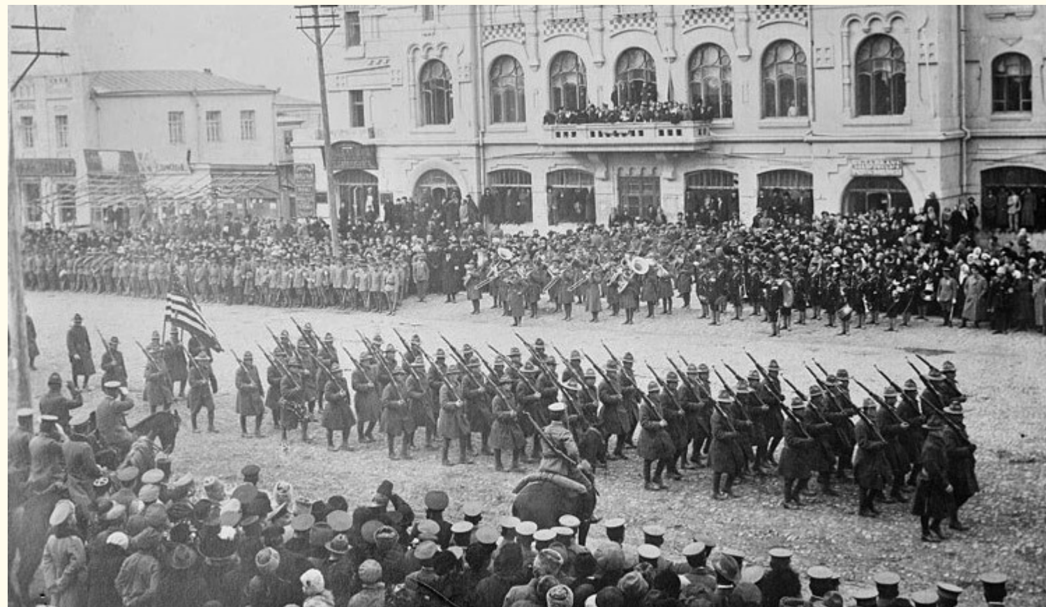
Американские пехотинцы — участники парада частей союзников в честь дня рождения императора Японии. Хабаровск, 31 октября 1918 г.

5 сентября 1918 года Хабаровск заняли белогвардейские части особого Уссурийского казачьего войска под командованием атамана И. П. Калмыкова и японский кавалерийский полк.