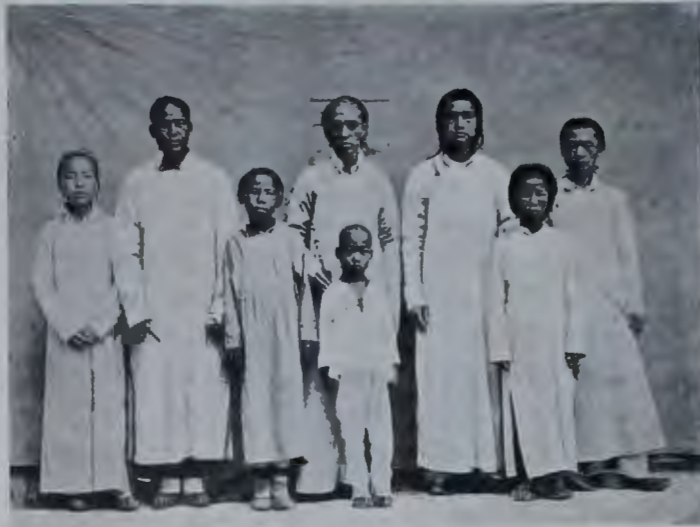
Албазинцы — потомки русскихъ, уведенныхъ въ Пекинъ въ 1685 году при взятіи китайцами г. Албазина.