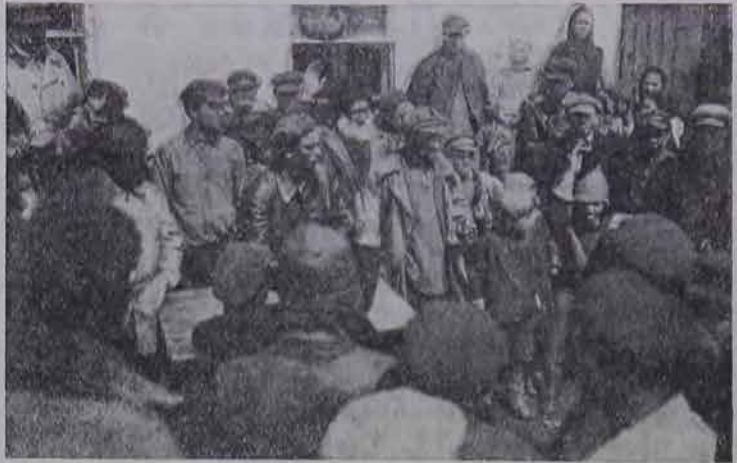
На собрании переселенцев 62-го участка Джанкойского района в Крыму.

Наконец, о пригодности Биро-Биджана для сахарной промышленности можно было бы судить на основании обследования построенных 2-х сахарных заводов в районе гор. Харбина, а именно, при станции Ашихе, Манчжурской дороги.