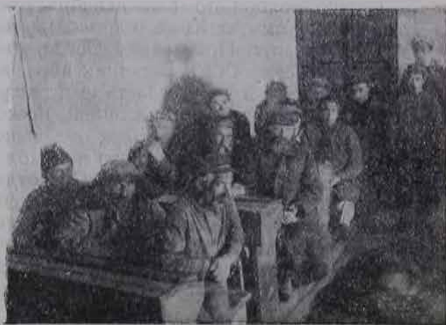
На собрании переселенцев в деревне Авода (Джанк. района).

Правда, мы заранее убеждены в том, что этой задачи нам в течение месячника не разрешить. Но это будет началом.