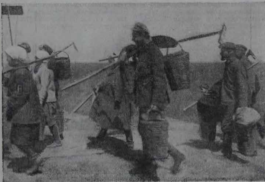
С поля. (Артель «Победа» Евпаторийского округа в Крыму).