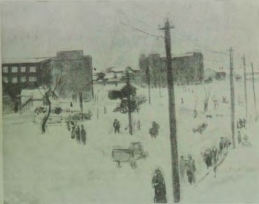
Л. Зевин. Биробиджанский пейзаж

(О выставке, организованной к IV пленуму ЦСО)