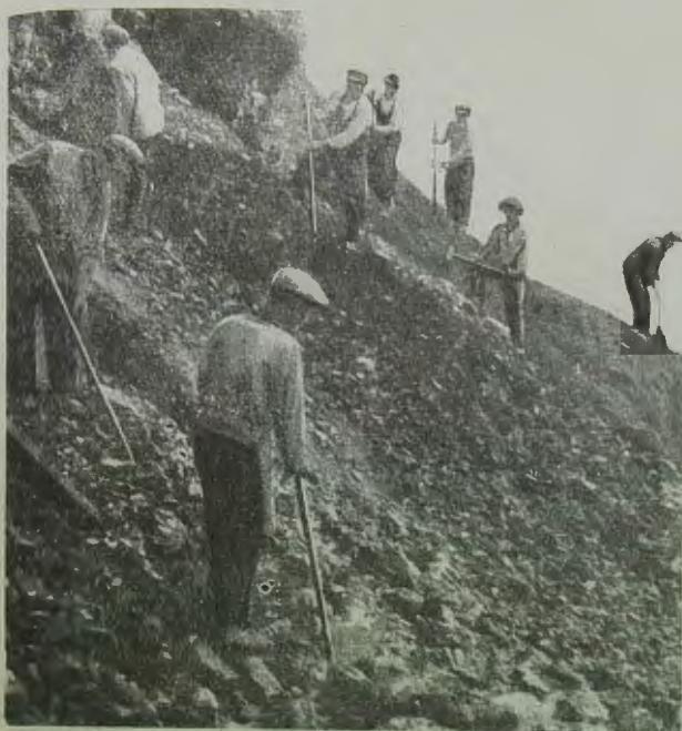
ЕвАО. На снимке: разработка известкового карьера в Лондоко

но. Поэтому речь должна идти лишь об организации этой работы. Возможно, я ошибаюсь, но чистосердечно признаю, что я лично отказался бы от ряда людей из местечек, по внешнему признаку и подходящих для ЕвАО. Если после 18—19 лет Великой Октябрьской революции, мы находим контингент, которые еще болтаются в местечках без дела, то конечно нам нужно от них отказаться. Не в такой рабочей силе нуждается область!