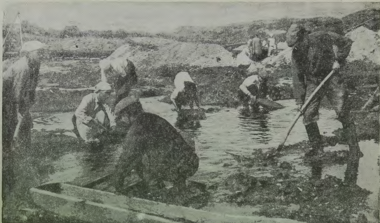
ЕвАО. На сутарских золотых приисках

но иметь в ЕвАО представителя Центрального Совета Озета.) Если ваша мысль не заходит дальше того, чтобы иметь в области уполномоченного Центрального Совета Озета—это значит, что и в будущем мы будем работать так, как мы работали в 1935 году потому, что в прошлом году у нас был уполномоченный ЦСО. Я лично считаю, что речь идет о том, чтобы изменить по стахановски методы нашей работы и путем определенного влияния на общественность ЕвАО добиться совершенно иного отношения к нашей шефской работе. Это — мой первый тезис.