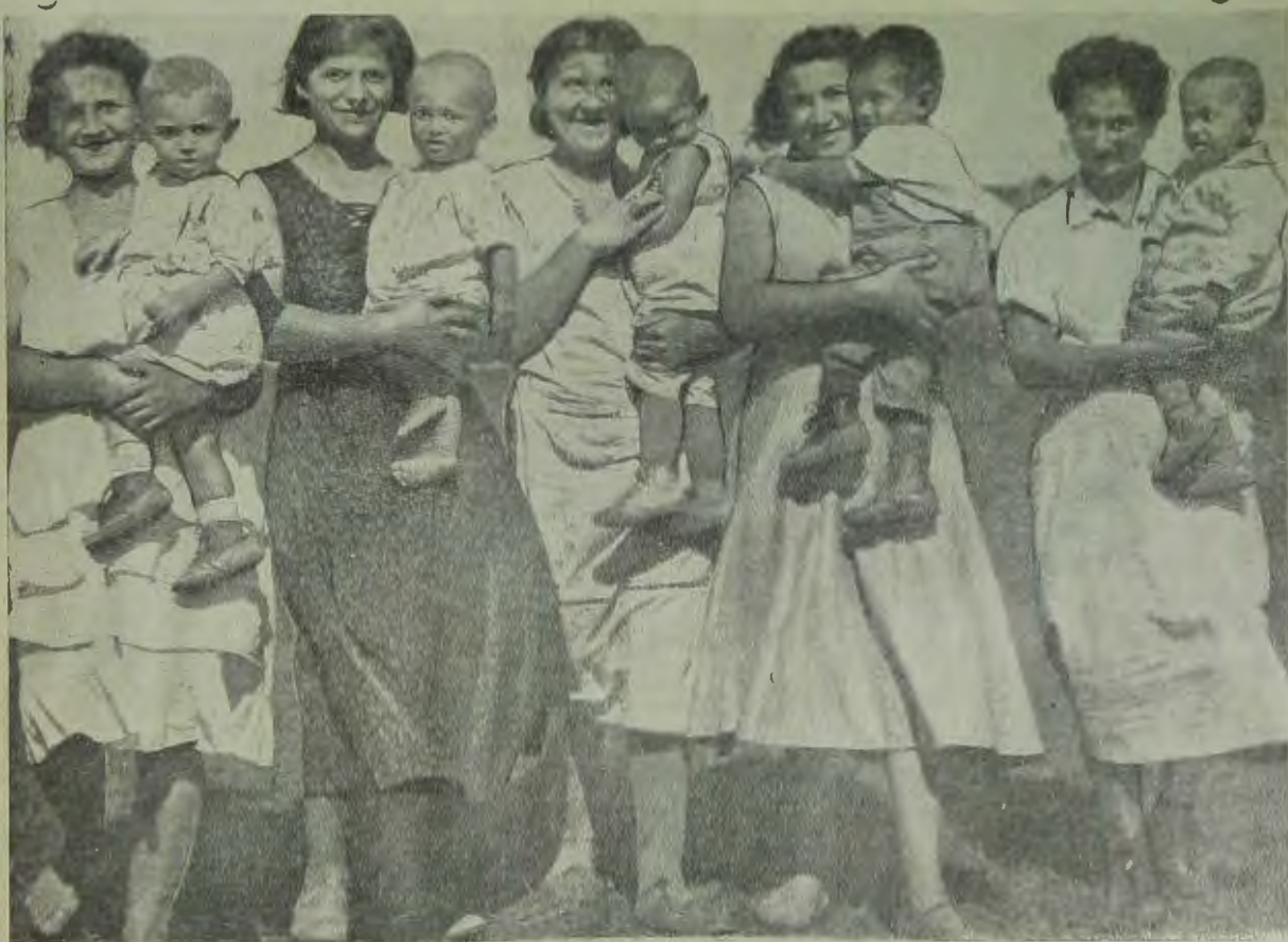
Растет молодая, счастливая смена!

ЕвАО. На снимке: матери—колхозницы колхоза „Икор“ с юными „биробиджанцами“