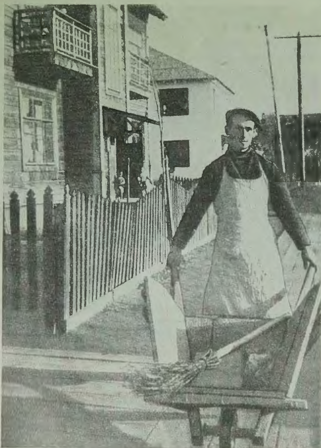
ЕвАО. Дворники г. Биробиджана следят за чистотой улиц

Слетелись стахановцы из разных концов Еврейской автономной области — из Биробиджана, Биры, Облучье, с Сутарских золотых