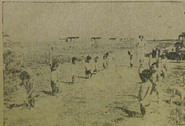
Крым. Колхоз Алчин. Зарядка на детской площадке

... 6. Поручить Комзету при президиуме ВЦИК, правительству Крымской АССР и НКЗему РСФСР провести необходимые мероприятия по дальнейшему укреплению переселенческих еврейских колхозов, в частности по обеспечению их тягловой силой и агротехнической помощью и оказать полное содействие в приобретении продуктивного скота для колхозников в соответствии с постановлением СНК СССР и ЦК ВКП(б) от 5 ноября 1933 года.