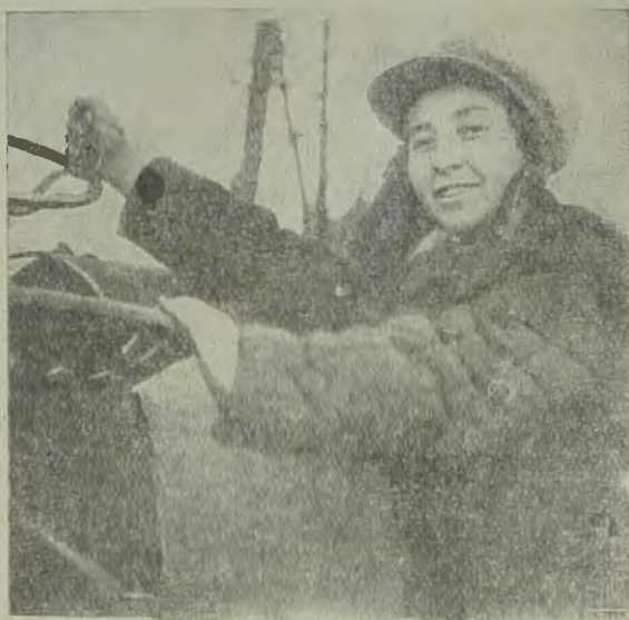
Еврейская коммуна „Красная звезда“ (Харьков) трактористка за работой.

8 марта напоминает нам о наших обязанностях, о том, чего мы не сделали и что мы еще должны сделать.