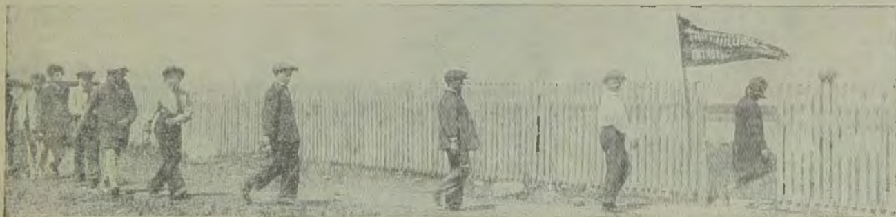
Пионер-отряд направляется на Сазу.