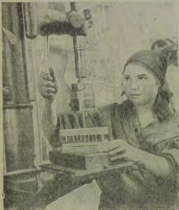
Ударница МТС за работой. (Херс. омп.).

В прошлые годы наши ОЗЕТ-организации не принимали никакого участия в «Дне работницы». Это было большим политическим упущением, которое не должно повториться. День 8 марта, являющийся днем подчета наших достижений на фронте вовлечения трудящихся женщин в борьбу за скорейшее построение социализма, должен вместе с тем стать днем выявления всех недочетов, ошибок и недостатков в этом деле.