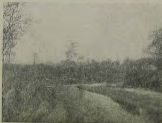
Биробиджан. Река Самарча.

ОЗЕТ и его местные отделения должны в этом основном звене работы Биробиджана проявить настоящие большевистские темпы. Лозунг — квартира переселенцу — должен стать самым популярнейшим. Что же касается приема и обслуживания переселенца, о чем речь шла выше, то в этом отношении сдвиг налицо. Прежний тихоньковский приемный барак умирает. Его место заняло хорошо обставленное общежитие, для которого заказаны и частично уже погружены постельные принадлежности, кровати и т. п. Вопрос о бане также разрешен. На очереди вопрос о белье для прибывающих переселенцев. Культурных развлечений еще мало, но и в этом отношении сдвиг есть. Ничего еще не сделано для изменения условий жизни переселенцев в пути, а они не сладкие. Особо плохо в дороге обстоит с горячей пищей. Переселенче-