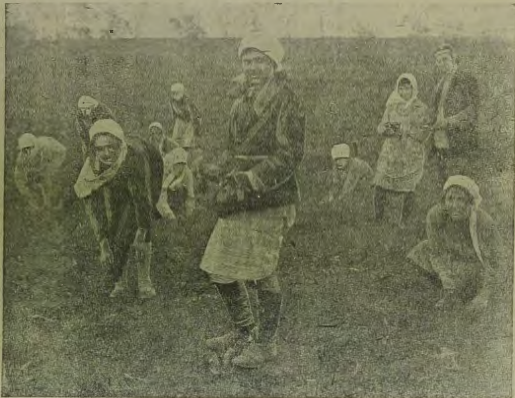
Чеботарские (Крым) с. х. курсы. Нурсантни на огороде.

...Места должны ускорить как темпы вербовки, так и отправки переселенцев на фонды. Работники мест выхода должны помнить, что успех сева зависит в первую очередь от энер-