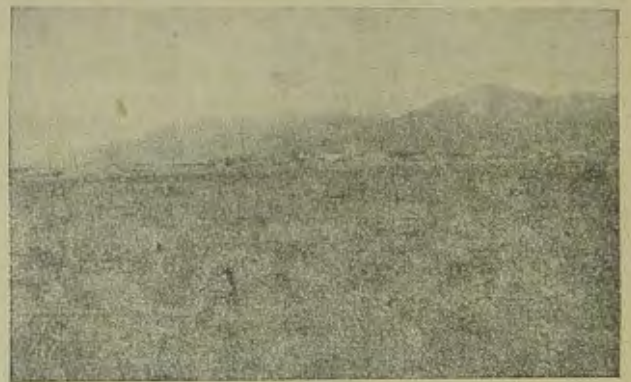
Село Лазарево (Биробиджан).

Но наша пятилетка строится не только на гигантах,—в баланс социалистического строительства одновременно с Днепростроем включается целая сеть электро-энергетических центров местного значения; одновременно с Магнитогорском, рассчитаным на выпуск 4,5 миллионов тонн металла в год, строится новый металлургический завод на западной окраине Восточной Сибири — в Петровске Забайкальском, рассчитанный на ежегодный выпуск