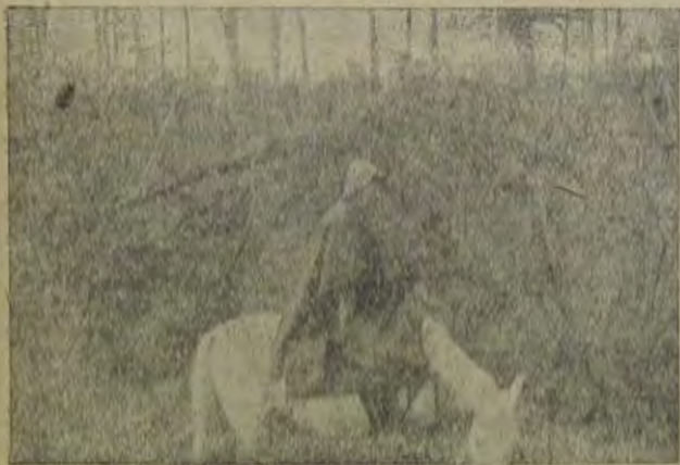
По биробиджанской тайге.

32.000 тонн металла. Заданием этого завода являлось удовлетворение потребностей в металле Дальневосточного края, так как Петровск—Забайкальский до сентября 1930 г. входил в состав Дальнего Востока. В настоящее время, с изъятием бывшего Читинского округа и Петровска Забайкальского из состава Дальнего Востока и выделением Восточно-Сибирского края, перед Дальневосточным краем выплывает вопрос о создании новой металлургической базы в пределах края для удовлетворения все возрастающих требований на металл со стороны быстрорастущей краевой промышленности.