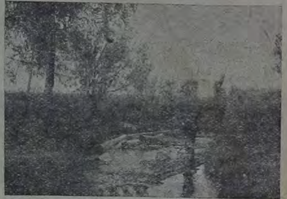
В Биробиджане сплавляют лес по рене Имур