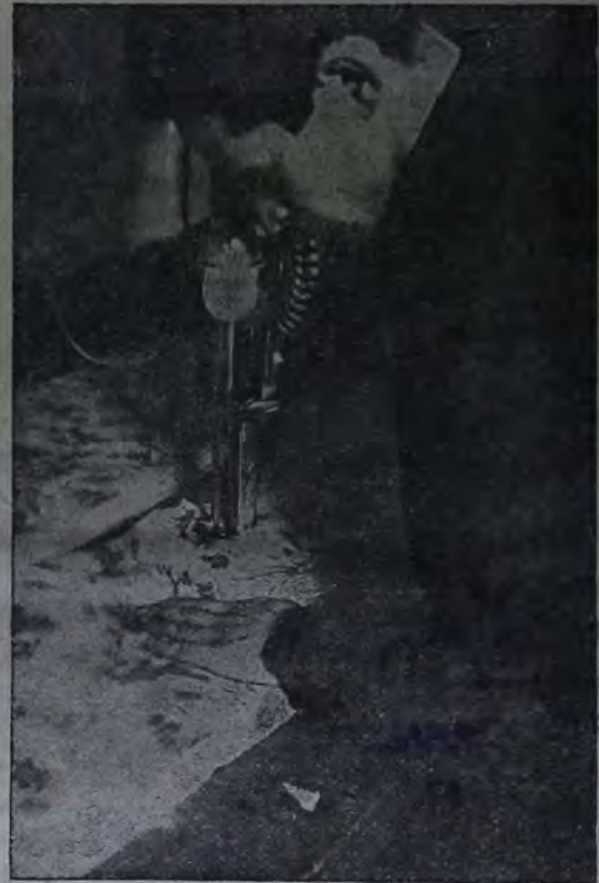
На фабрике „Октябрь“ Миншвея. Занройщик

В Биробиджане еврейскому населению предоставлено 4 миллиона га земли. Работу в этом районе придется вести лишь