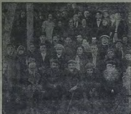
Открытие с.с в Вальдгайме (Бироб.)

Работа по землеустройству трудящихся евреев является составной частью всего плана переустройства, соц. реконструкции хозяйства страны. Эта работа строится и подчинена основным законам и директивам партии и правительства. Вся сумма мероприятий, проводимых Комзетом и Озетом, является частью общего плана ликвидации того наследства, которое досталось пролетарскому государству от времен царизма.