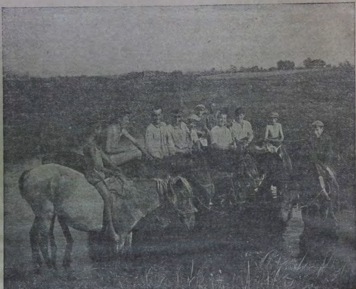
Лошади колхоза на водопое.