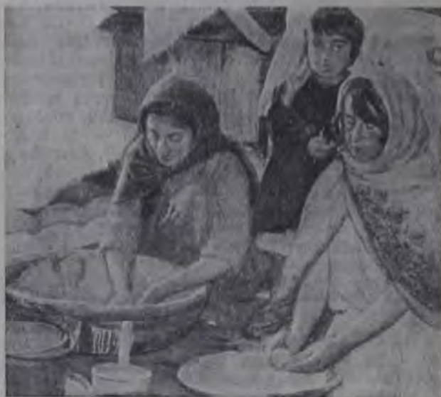
В горско-еврейском поселке Евпаторийского района в Крыму. Месят тесто.