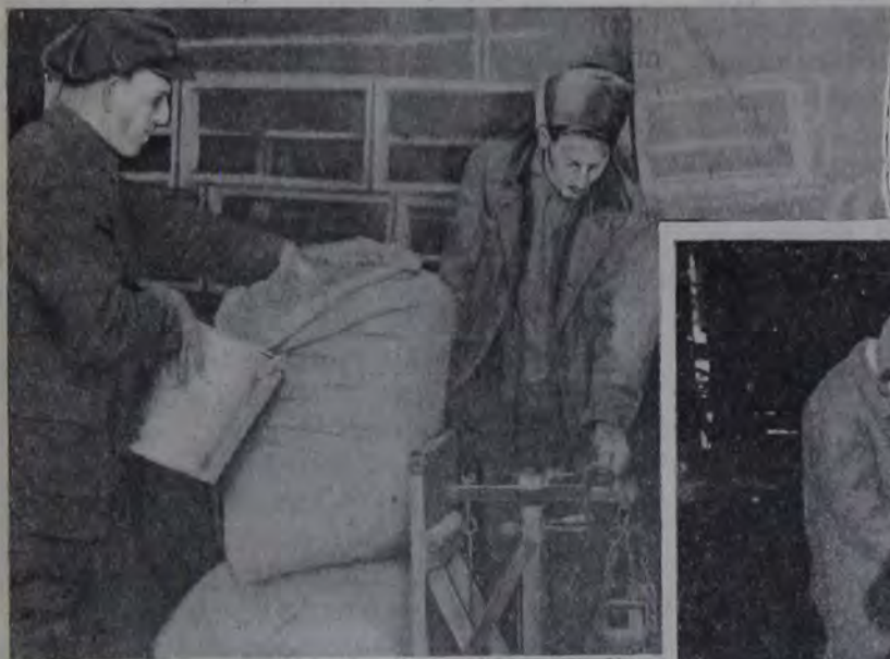
Посевная кампания в евр. колониях: слева — отпуск семзерна в Евпатории; справа — починка сеялки в евр. колхозе (БССР).

Вдруг по степи разнеслись слухи, что прибывают новые переселенцы.