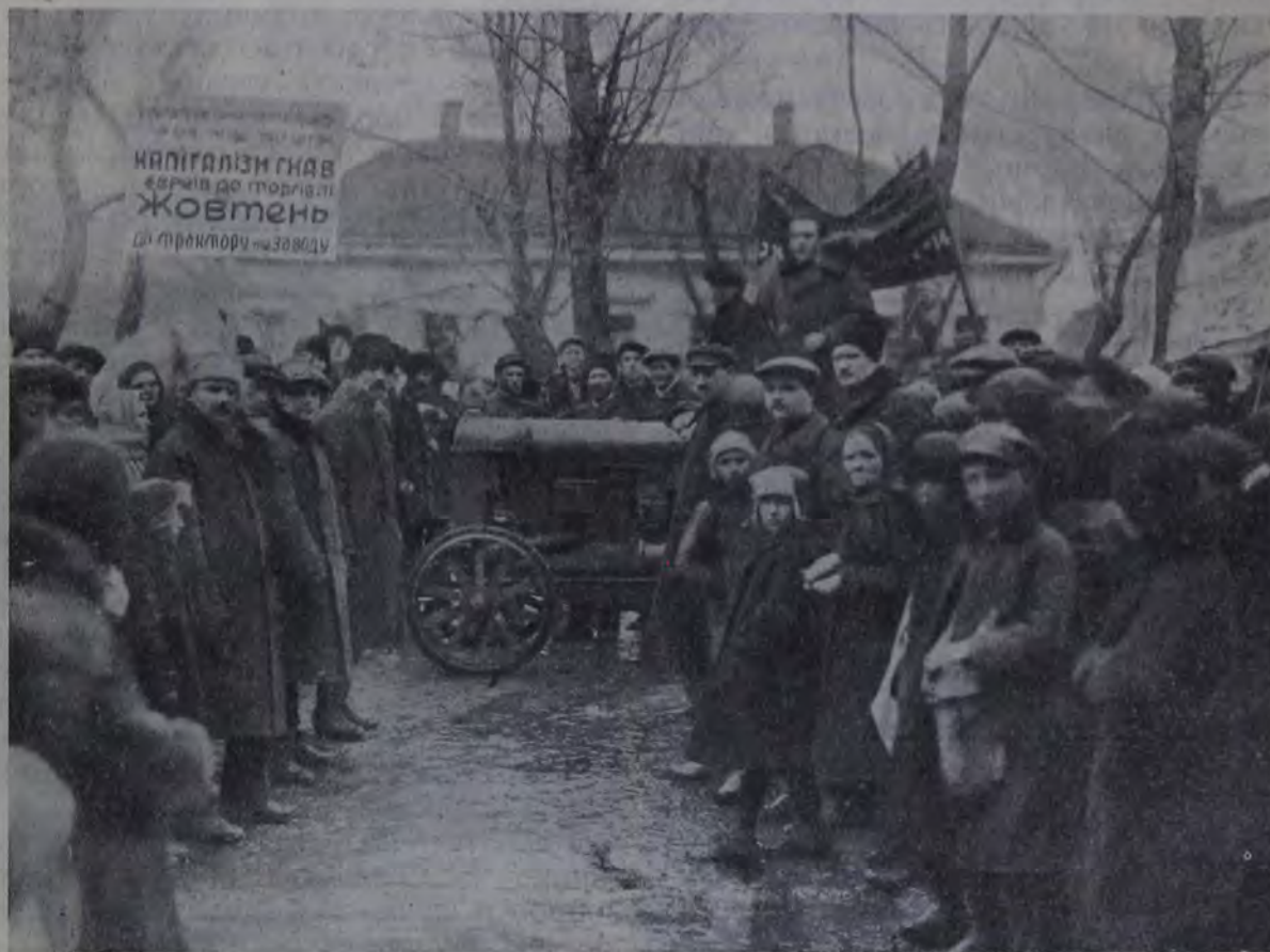
Проводы переселенцев (Днепропетровск).

Мы знаем, что работа «Икора» не легка. Ему приходится пробивать густую атмосферу лжи и клеветы, обильно распространяемых врагами коммунистической партии и социалистического