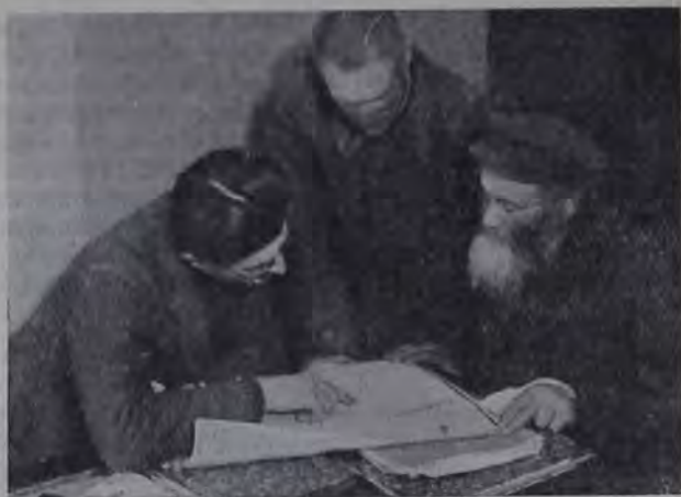
Записываются в коллектив (БССР).

Комсомольские ячейки крымских еврейских колоний энергично двинулись в поход по поднятию урожая. Ведется не только, раз'ясни-