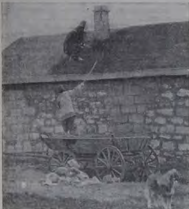
В горско-евр. поселке на 36-м участке Евпаторийского района в Крыму. Обмазка крыши.

Отделения Озета имеются только в 4-х пунктах: в Махач-Кале, Дербенте, Буйнакске и Кизляре. Число членов Озета по всему Дагестану достигает 1940 человек, но многие из них являются фиктивными членами. Членские взносы крайне мало взыскиваются. Массовая работа не ведется. «Трибуна» распространяется всего в количестве 25 экземпляров. Культурно-медицинская помощь расселенцам оказывается сла-