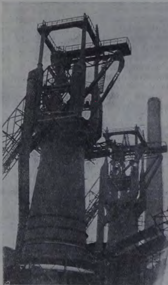
Домна на Керченском заводе, пущенная к Первомайским дням. (См. стр. 26).

Еврейские рабочие в России были одними из первых, которые праздновали революционным