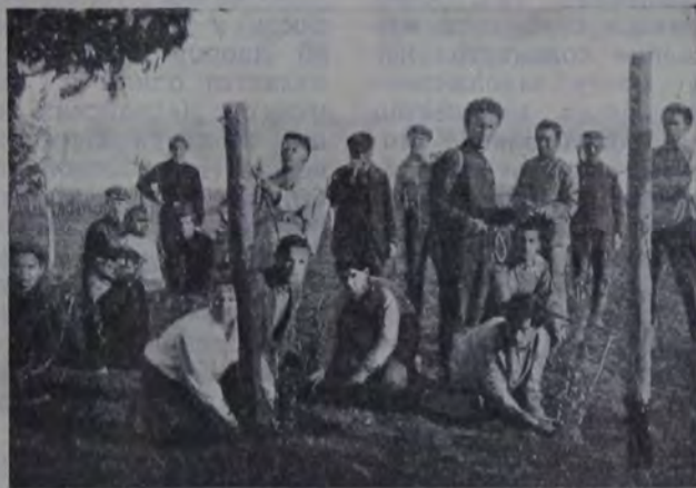
Студенты на винограднике.

Агрономы, окончившие техникум, имеют подготовку не ниже вузовской. Часть из них уже привлечена к работе на еврейских фондах. Калининдорфский район пригласил 4 агрономов, одного зоотехника, одного коллективизатора и двух кооператоров. Комзет пригласил двух агрономов для Ленинского фонда Херсонского округа. Один агроном будет работать в старой еврейской колонии Нагатов.