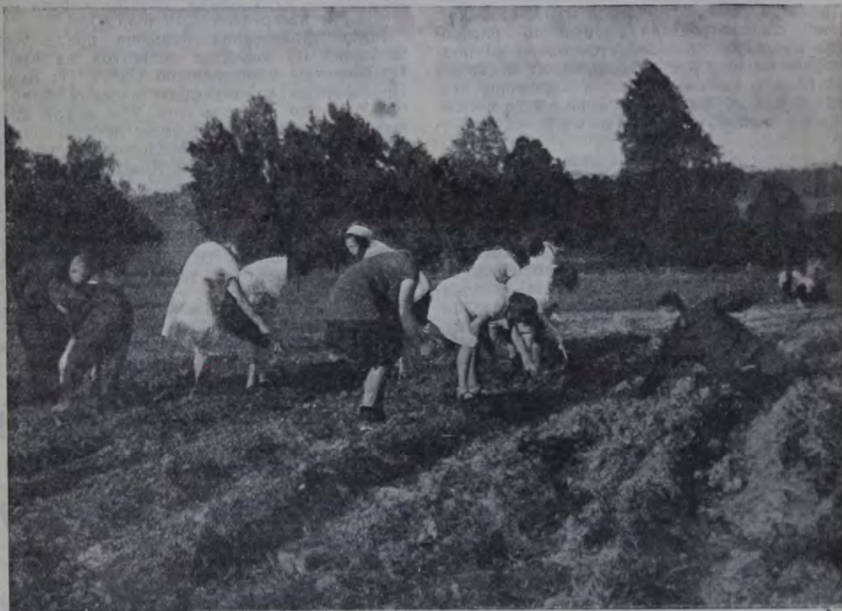
Еврейские пионеры в поле.

Пионеры и комсомольцы! Станьте живым ферментом в ячейках Озета.