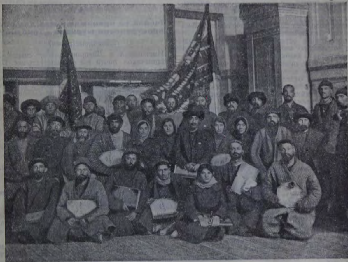
Делегаты первого всеузбекского с'езда евр. дехкан и кустарей.