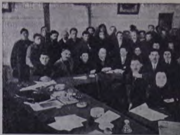
Американская евр. рабочая делегация в Совпрофе БССР в Минске.

Дорогой мы изрядно утомились и прозябли. Открыть ли беседу с работниками района и получить все необходимые сведения о районе, его состоянии, перспективах и т. д. или отдохнуть? Размышлять, однако, пришлось недолго: явилась группа молодежи с сообщением о том, что население валом валит в избу-