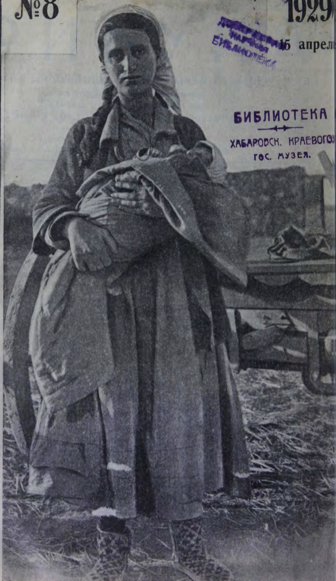
Горско-еврейская переселенка на 36-м участке Евпаторийского района в Крыму.