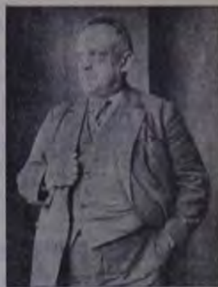
Тов. Семашко Н. А.

Подробный отчет о пленуме будет дан в следующем номере.