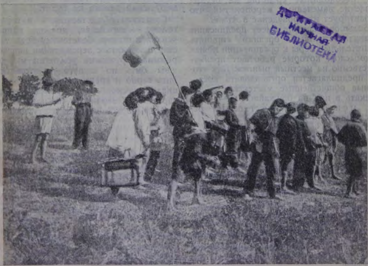
Ученики Кодлубицкой евр. с.-х. школы (Киевщина) отправляются на экскурсию.

Мы можем уверенно сказать, что с каждым постановлением советских ор-