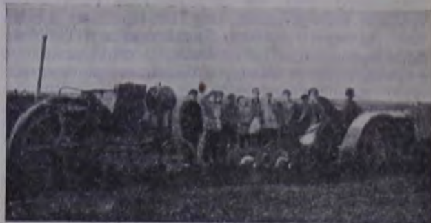
Работа студентов с трактором.

После 4½ лет учебы Ново-Полтавский еврейский с.-х. техникум выпустил первую группу еврейских агрономов в 21 человек, из них 4 женщины.