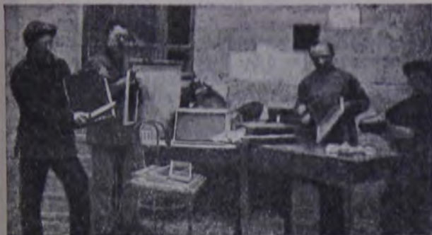
Студенты строят ульи.

Привет новому комсоставу евр. земледельческих поселков! Успешно ведите евр. деревню к социалистическому сельскому хозяйству!