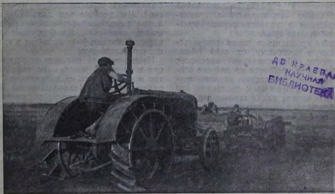
Вспашка под виноградник при помощи плантажного плуга и трактора (колония „Фрилинг“ Евпаторийского района в Крыму).

Президиум Совета Национальностей констатировал, что степень нужды еврейской бедноты требует от нас усиления темпа работы по переселению евреев на землю и по привлечению их к производительному труду через фабрично-заводское производство и культурное строительство.