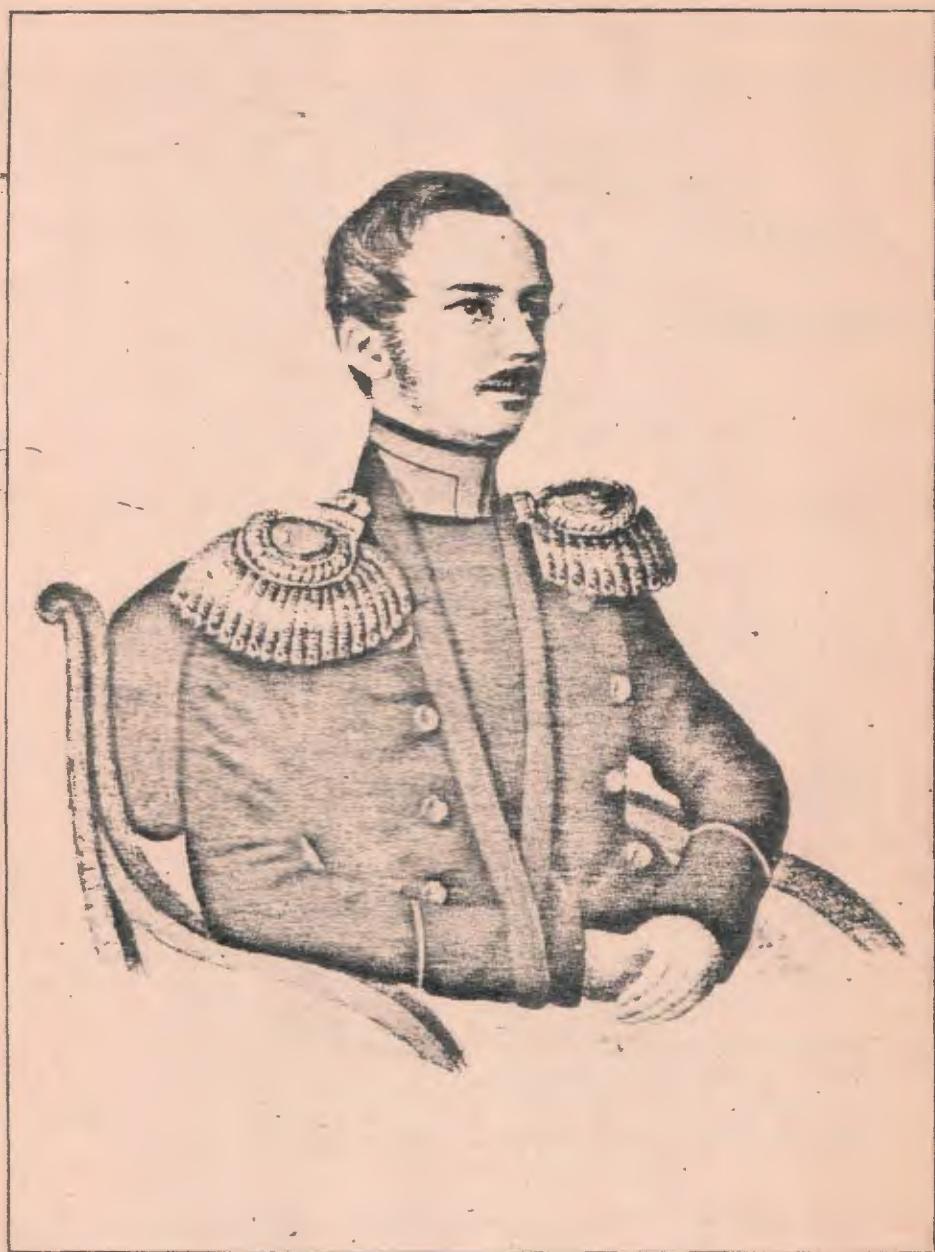
Н. Н. МУРАВЬЕВЪ (съ 1858 года Графъ Амурскій).