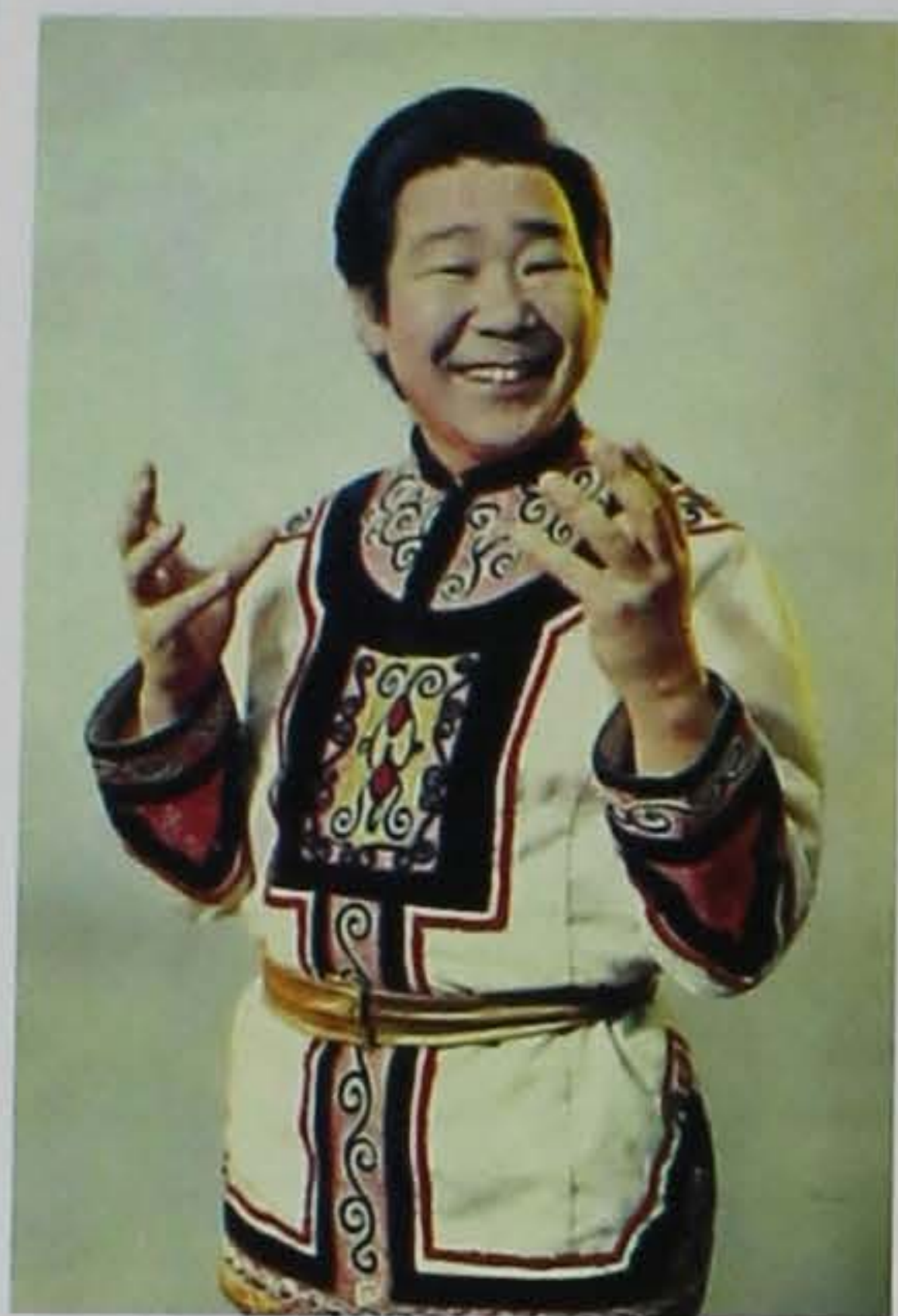
Кола Бельды, певец