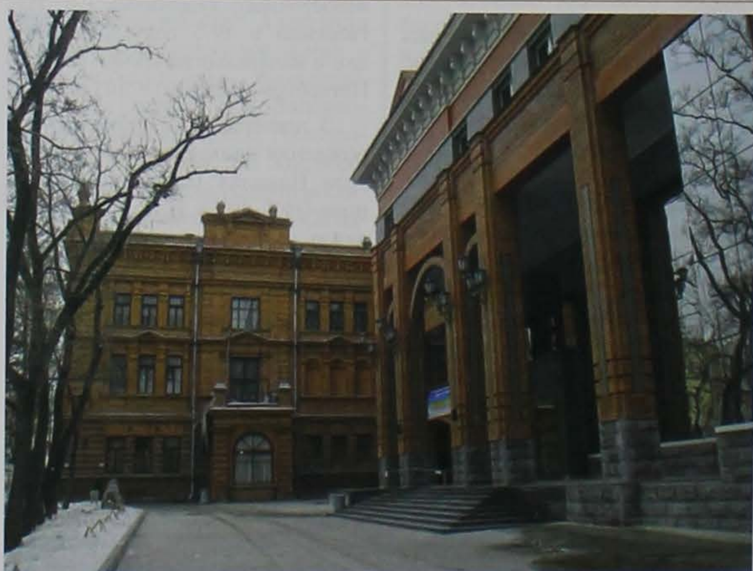
Хабаровский краевой музей им. Н.И. Гродекова

Подробная информация о знаменательных датах и выдающихся юбилярах 2014 года размещена в традиционных изданиях Дальневосточной государственной научной библиотеки «Знаменательные и памятные даты Хабаровского края в 2014 году» и «Время и события. Календарь-справочник по Дальневосточному федеральному округу на 2014 год». Электронные версии этих изданий можно найти на сайте библиотеки www.fessler.ru