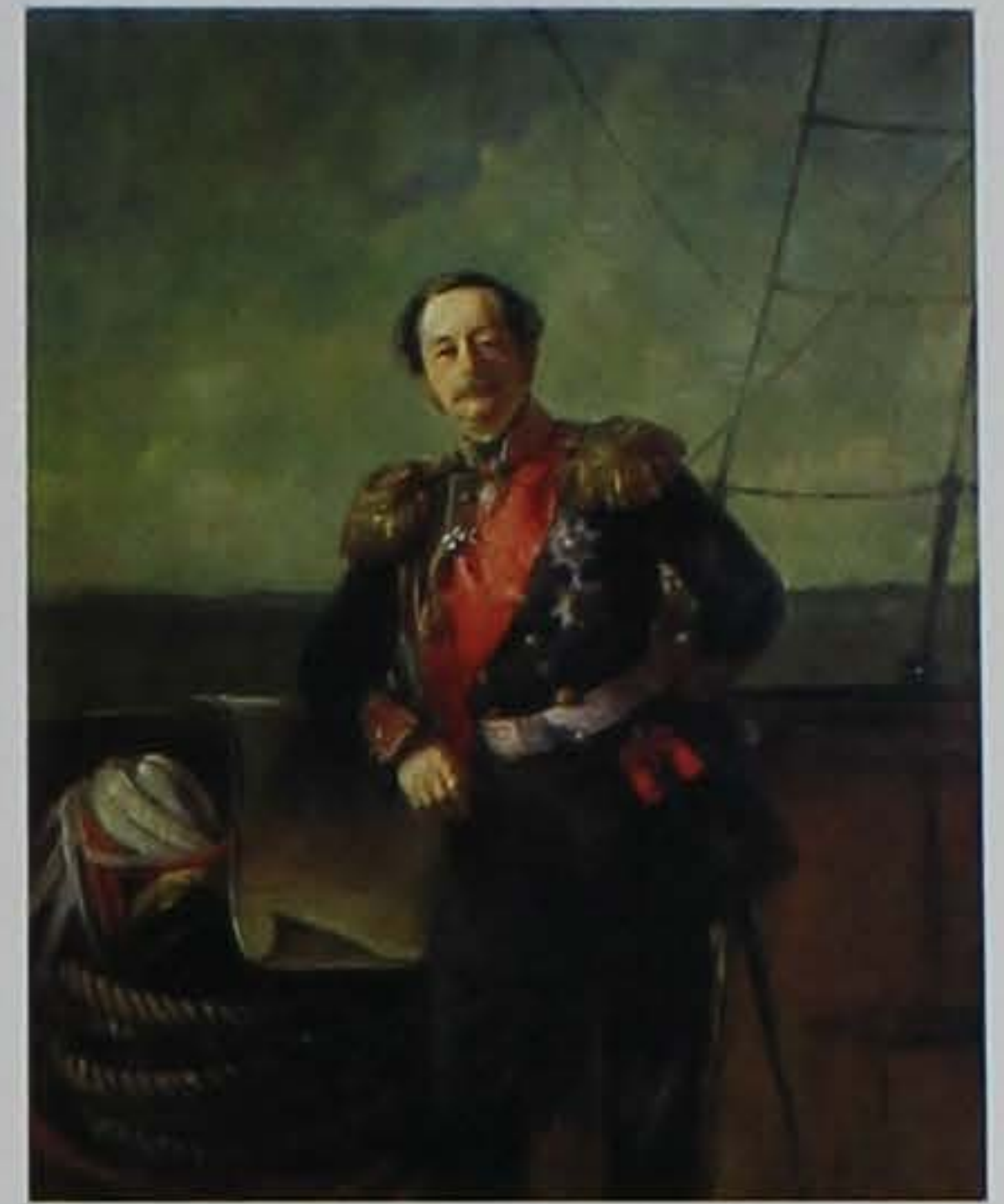
Граф Н.Н. Муравьёв-Амурский

23 (11) августа исполнится 205 лет со дня рождения генерал-губернатора Восточной Сибири Николая Николаевича Муравьёва-Амурского (1809–1881), благодаря деятельности которого в XIX веке был решён вопрос присоединения к России Приамурья и Приморья. За 13 лет губернаторства Н.Н. Муравьёв проявил себя не только умным администратором, но и дальновидным политиком и дипломатом. «Амурский вопрос» стал стержнем его деятельности. Он способствовал официальному утверждению в 1851 году Амурской экспедиции, в 1854–1858 гг. провёл четыре сплава по Амуру, главной целью которых было заселение и освоение амурских берегов. В 1858 году Н.Н. Муравьёв, имея все полномочия, предоставленные ему Александром II, в результате переговоров с Китаем подписал Айгунский договор, по которому за Россией официально был закреплён Амур от реки Уссури. После этого в 1859 году он был возведён в графское достоинство с присоединением к фамилии – Амурский. Ещё одним значимым деянием Муравьёва-Амурского на посту сибирского генерал-губернатора стало создание Амурского казачьего войска, призванного обеспе-