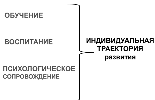
Рис. 1. Модель индивидуального патронирования иностранных обучающихся.

Создание системы индивидуального патронирования иностранных обучающихся (рис. 1) даст возможность объединить все составные элементы воспитательного педагогического воздействия с целью формирования в дальнейшем зарубежной «аграрной элиты» из числа лучших выпускников вуза – высококлассных специалистов, лояльных к России и готовых к межкультурному и межнациональному диалогу.