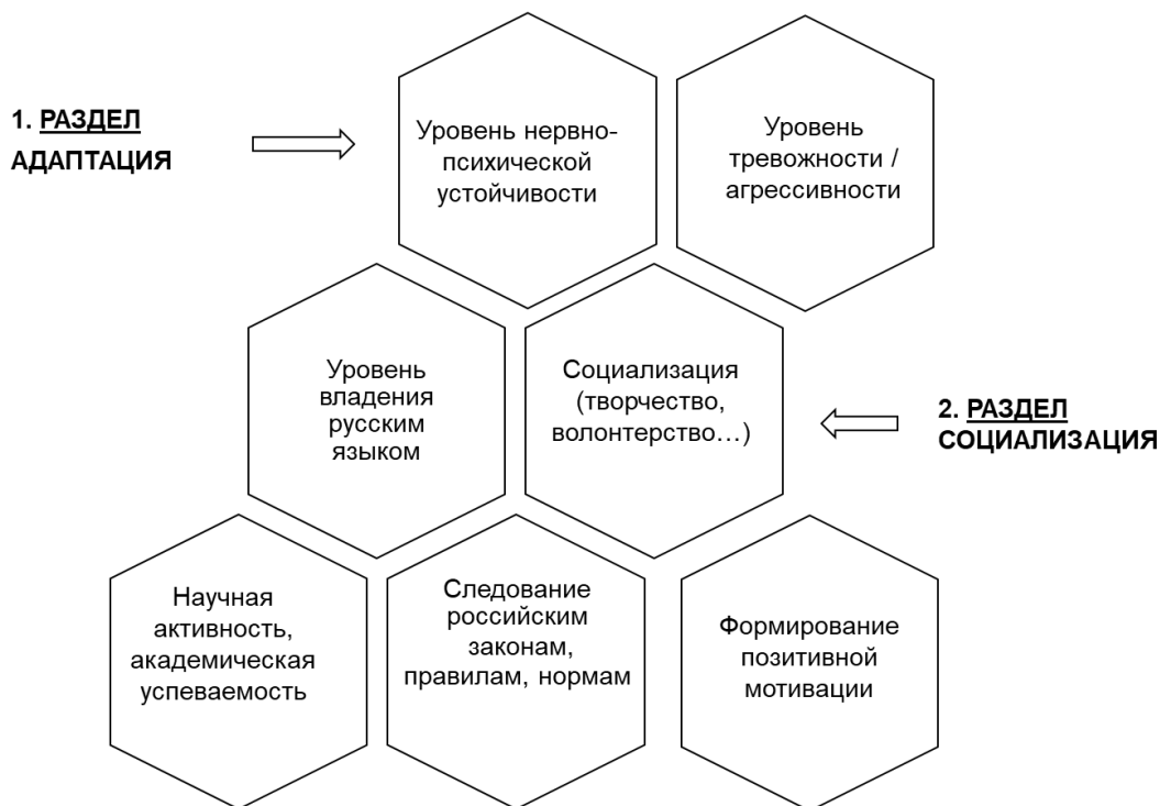
Рис. 2. Структура «Карты личностного роста» обучающегося

РЕЗУЛЬТАТ ожидаемых изменений личности – это формирование позитивной мотивации иностранного студента и его эффективная социализация в поликультурной среде вуза.