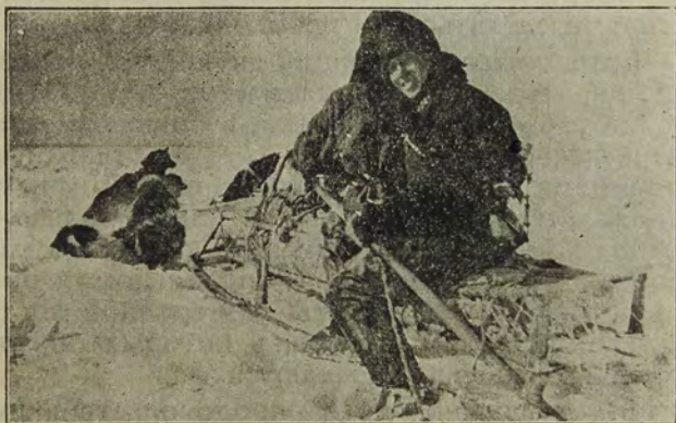
Китаец-скупщик в поездке за пушниной.

Каждый китайский купец—дипломат и психолог. Он желанный гость у туземцев. Его ожидают все с нетерпением. После ужина он вручает хозяину юрты заказ и лично ему делает еще какой-нибудь подарок. Вечером они курят трубки, как друзья, и ведут деловой разговор.