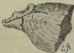
Головка пялки на соболя, обделанная в виде зверовой мордочки.

Китайская и корейская пялки делаются из дерева и имеют вид меча с тупыми краями, а ороцкая и тунгусская—состоят из двух или трех, соединенных у основания, прутиков, свободные концы которых связаны ремешком. Они часто бывают украшены резьбой, причем основание обделывается в виде головы медведя, соболя, лисицы и т. д.