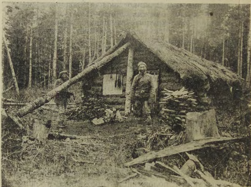
Охотники-китайцы в Уссурийской тайге.

глубокие снега, что обыкновенно происходило для бассейна Уссури и ее притоков в январе, а для Зауссурийского края—в декабре месяце. Возвращение соболевщика в деревню становилось известным в тот же день. Тогда все другие охотники