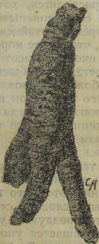
Жень-шень, приготовленный к употреблению.

ло выбрано в смешанном лесу, где есть кедр, чтобы оно находилось на северном склоне горы и отнюдь не на солнцепеке. Может случиться, что в первый год пан-цуй не прорастет. Если нет ростка, надо ждать терпеливо. Это значит, что корень не погиб и ждет благоприятных условий, которые в данный момент почему-либо отсутствуют. Вообще огородный жень-шень годится в продажу не ранее шестилетнего срока.